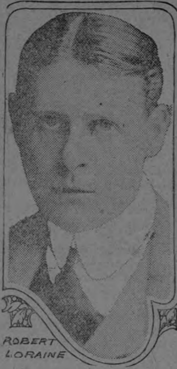
RECIBIO LA CRUZ MILITAR POR HEROISMO

TERS ha redoblado su violencia. En la tarde los alemanes lanzaron un poderosísimo ataque contra este sector, pero lo rechazamos en todos los puntos del frente con serias pérdidas para ellos. Pusieron pie solamente en dos puntos de nuestras trincheras entre Beincoart y Lamortime. Al Oeste del Mosa, en Woeyre, las baterías por ambos lados estuvieron muy activas. Al Norte de St. Michel nuestras baterías bombardearon algunos campamentos importantes del enemigo. En Boisduicourt causando un gran incendio en la estación y en los almacenes militares. En Lorena cañoneamos una columna que se dirigía por el ferrocarril al Noroeste de Delmé. En las Vosgos ambas artillerías están desplegando gran actividad en el sector de Châpelote y en el valle del Thur. Un ataque de sorpresa contra las trincheras del enemigo en Stooséir y Carspach nos permitió tomar 69 prisioneros e importante material de guerra sin pérdida alguna de nuestra parte. Seis aeroplanos con motor doble arrojaron 42 grandes proyectiles a la estación de Brielles. Al Norte de Verdún hubo numerosos combates aéreos y se vió a tres má-