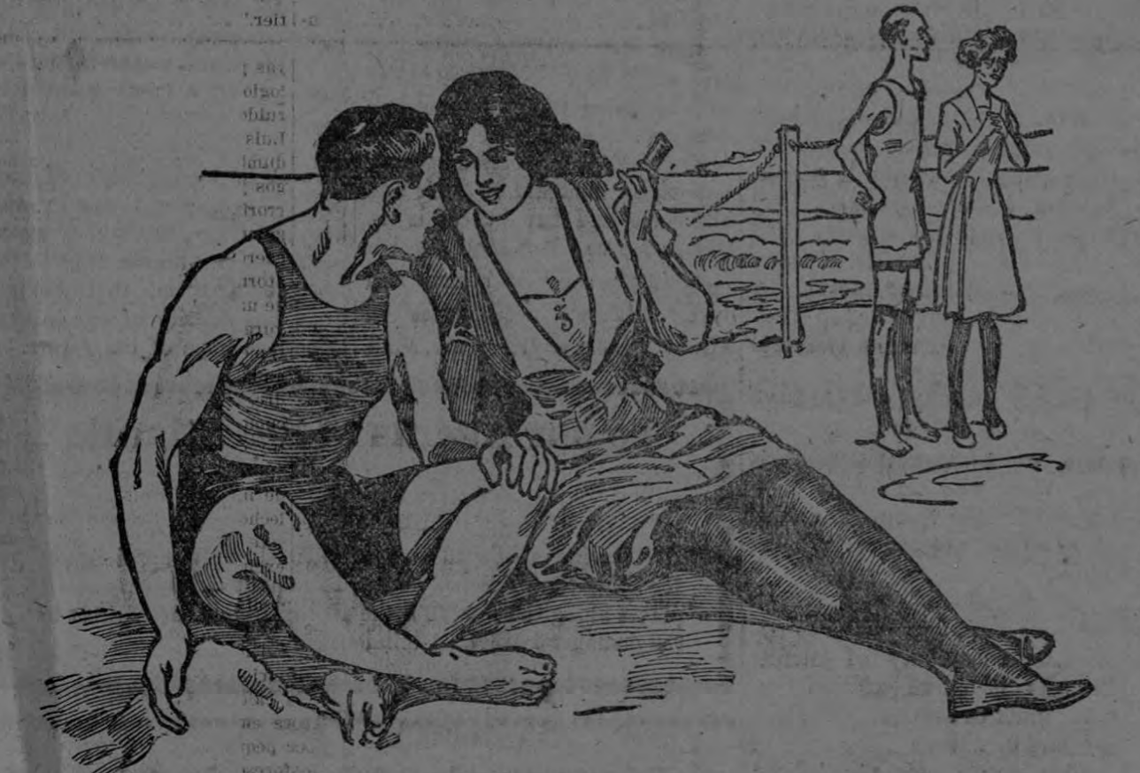
Fíjate en aquel par de raquíticos. ¿Por qué no tomarán Sargol para engordar?

La mayoría de las personas delgadas comen de 4 a 6 libras de alimentos nutritivos todos los días y a pesar de esto no aumentan ni una sola onza de carnes, ni grasas que, por el contrario, muchas de las gentes gordas y robustas comen muy poco cosa y siguen engrosando continuamente.