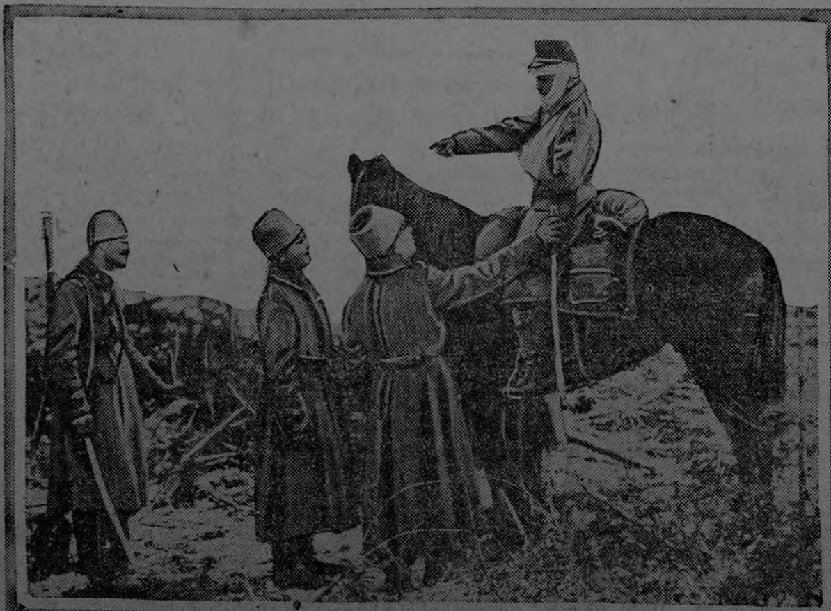
RUSSIANS QUESTION WOUNDED AUSTRIAN IN GALICIA.

AMSTERDAM. — Despacho semi-oficial de Constantinopla anuncia que aparentemente los ingleses están en camino de recibir refuerzos en Kut-el-Amara y que atacaron la posición turca de Sheik Seid, donde perdieron tres mil hombres y fueron repelidos.