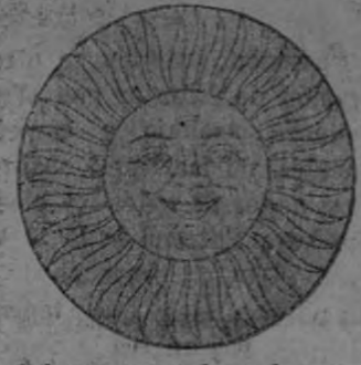
El Sol que a usted ayuda cuando necesita más.