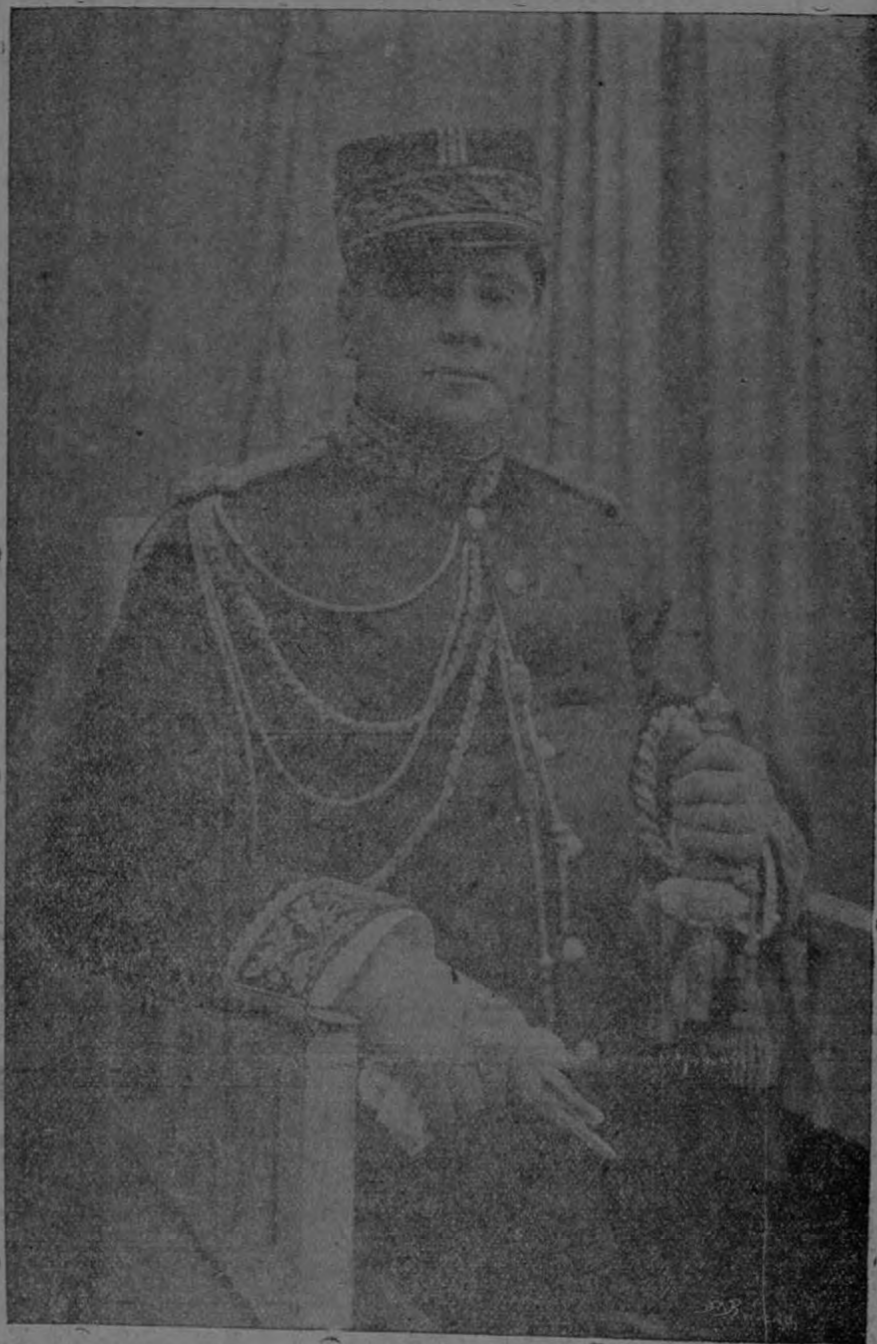
GENERAL DON FEDERICO A. TINOCO GRANADOS Presidente Provisional.

tarde pudimos conseguir la fotografía y no hubo tiempo suficiente para grabar el cliché. Sin embargo, en próximo número remediaremos la falta.