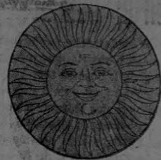
El Sol que a usted ayuda cuando necesita más.