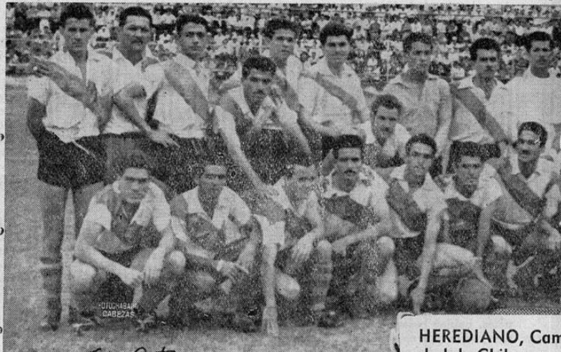
HEREDIANO, Cam- peón de Chile que s

¡Salud, campeones florenses.— Las flores de tus campos tejen sus guirnaldas y los perfumes se encargan de saturar tu ambiente con los tintes de la ilusión y el optimismo apoteósico de tu victoria. . . Y HEREDIA es ahora Campeón