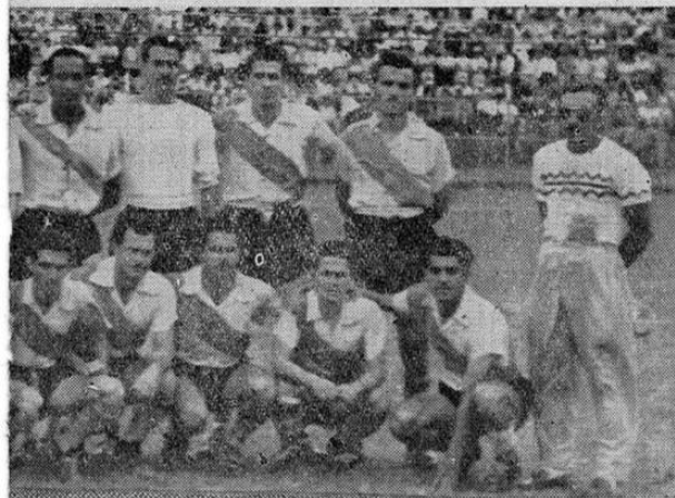
Campeón Nacional 1951 vencedor del Banfield y Universitario enfrentará al SEVILLA, el domingo 13 de Julio.

1921-1922-1924 1927-1930-1931 1932-1933-1935 1937-1947-1948-1952