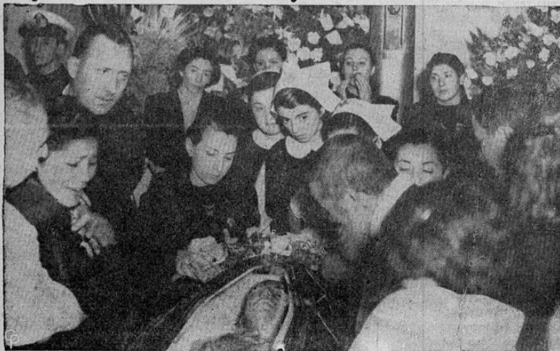
En esta foto se puede ver claramente el rostro de la señora Eva Perón a través de la cubierta de vidrio de su ataúd. La foto fue tomada ocho días después del fallecimiento de la señora del Primer Mandatario de la Argentina cuando millares de personas seguían pasando a diario junto a sus restos.