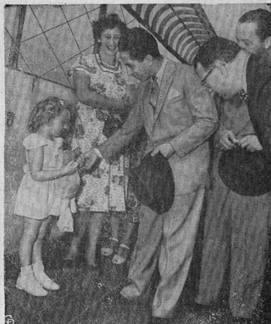
Durante su visita a la torre del edificio Empire State, en Nueva York, el Rey Feisal II, del Iraq, se inclina para saludar a otra visitante, Nancy Cofield, de 4 años, de Atlanta, Georgia.

EL REY FEISAL DEL IRAN EN EL EMPIRE STATE BUILDING