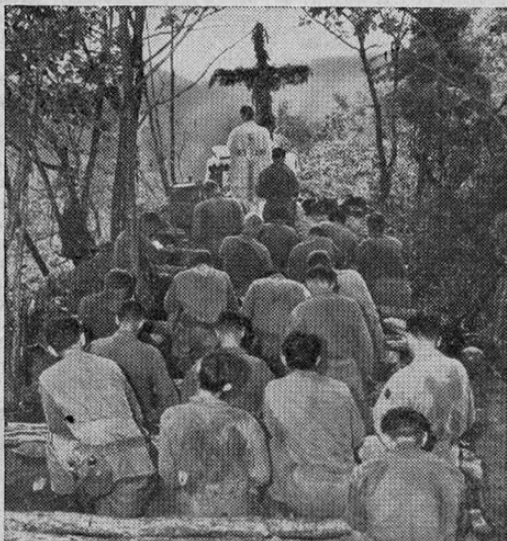
Los sentimientos religiosos de cada soldado de las Naciones Unidas son respetados y estimulados. Aquí vemos una improvisada capilla levantada tras la línea de fuego, en Corea, donde un Capellán está diciendo la Santa Misa de la Religión Católica Romana, y los soldados de las Naciones Unidas, fervorosamente, siguiendo el rito para alentar sus espíritus en la tremenda lucha que las naciones libres se han impuesto contra los agresores comunistas.