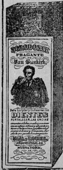
Esta es la agura exacta del paquete según se muestra.

HALL & RUCKEL, 215 Washington St. New York, EE. UU. de A.