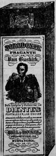
Esta es la figura exacta del paquete según se vende.

HALL & RUCKEL, 215 Washington St., New York, N. Y. U. S. A.