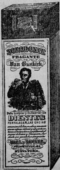
Esta es la figura exacta del paquete según se vende.

HALL & RUCKEL, 218 Washington St., New York, N. Y., U. S. A.