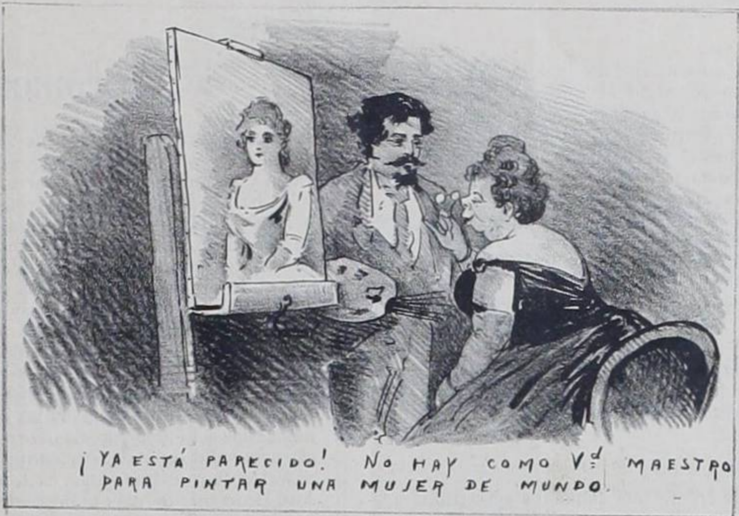
¡YA ESTÁ PARECIDO! NO HAY COMO V.º MAESTRO PARA PINTAR UNA MUJER DE MUNDO.