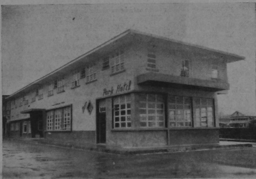
Este es el Hotel Park, uno de los edificios más modernos de Limón.