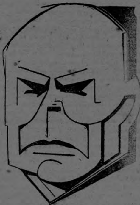
BALDOMERO SANIN CANO

Esculpido en piedra viva, el rostro ancho, enérgico y viril. Airado el mentón. Apretados los labios en actitud afirmativa. Alta y despejada la frente sobre la maraña hirsuta de las cejas plateadas que sombrean la mirada incisiva y penetrante. Con algo de nórdico, algo de vasco y algo de sajón, iluminado por la luz del trópico, SANIN CANO presenta una noble estampa de varón dominante y pensador.