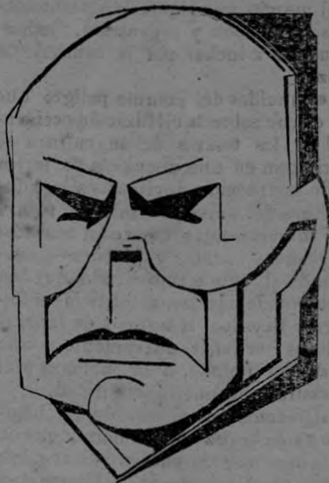
BALDOMERO SANÍN CANO

Por su pasión de verdad y de justicia, Sanín Cano es el maestro que guía rectamente, por el camino de la serena reflexión, hacia el dominio de los más variados conocimientos y de las más ricas experiencias intelectuales. El decano de los periodistas