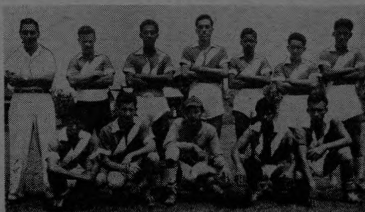
Posan para EL PACIFICO al prepararse para el campeonato.