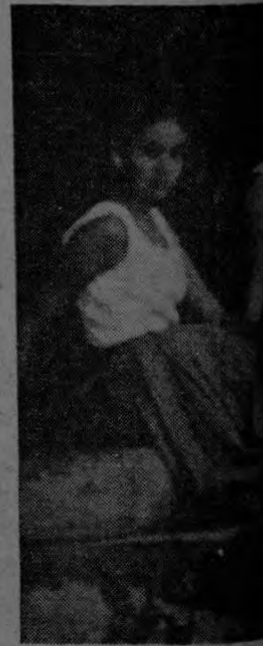
Este grupo de lindas damitas descansa cerca del balneario Bermúdez Carvajal y Ana del balneario, junto a los

Nos será muy grato hacer una reseña de este viaje y, en especial, de las actividades deportivas que se ha dispuesto realizar en Armuelles durante los días de la excursión.