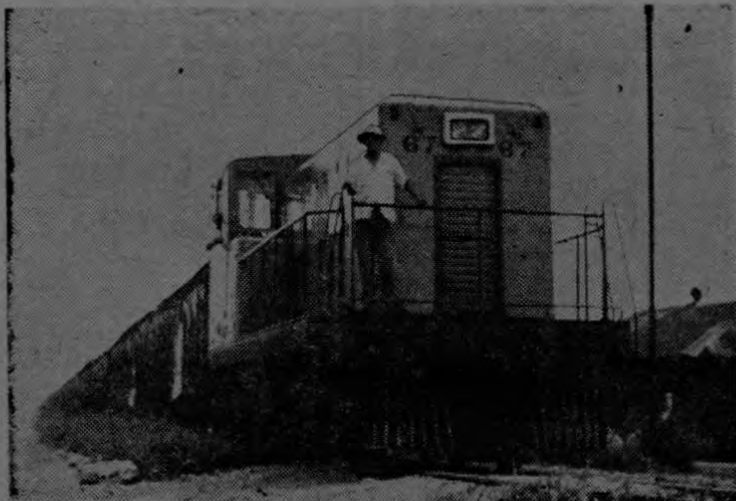
La Diesel N° 67 arrastra el largo tren bananero. Va llegando el convoy a Coto 50, donde nuestra cámara lo capta. En la plataforma de la 67, el ayudante Rodolfo Espinoza; en el control de la locomotora, el maquinista Róger Zelaya.