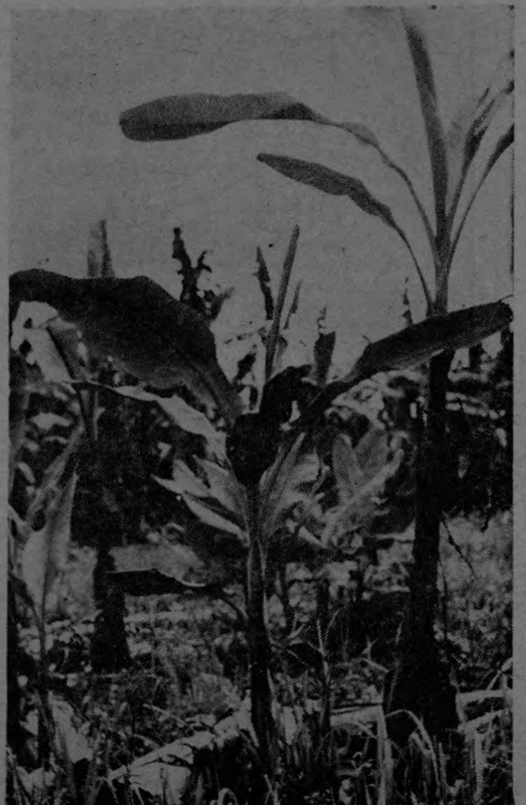
La botazón de plantas por los vendavales que azotaron en el pasado mes de julio el Valle de Coto fue grande. Aquí vemos los renuevos prometedores en Coto 49, una de las fincas más afectadas por esos vientos destructores.