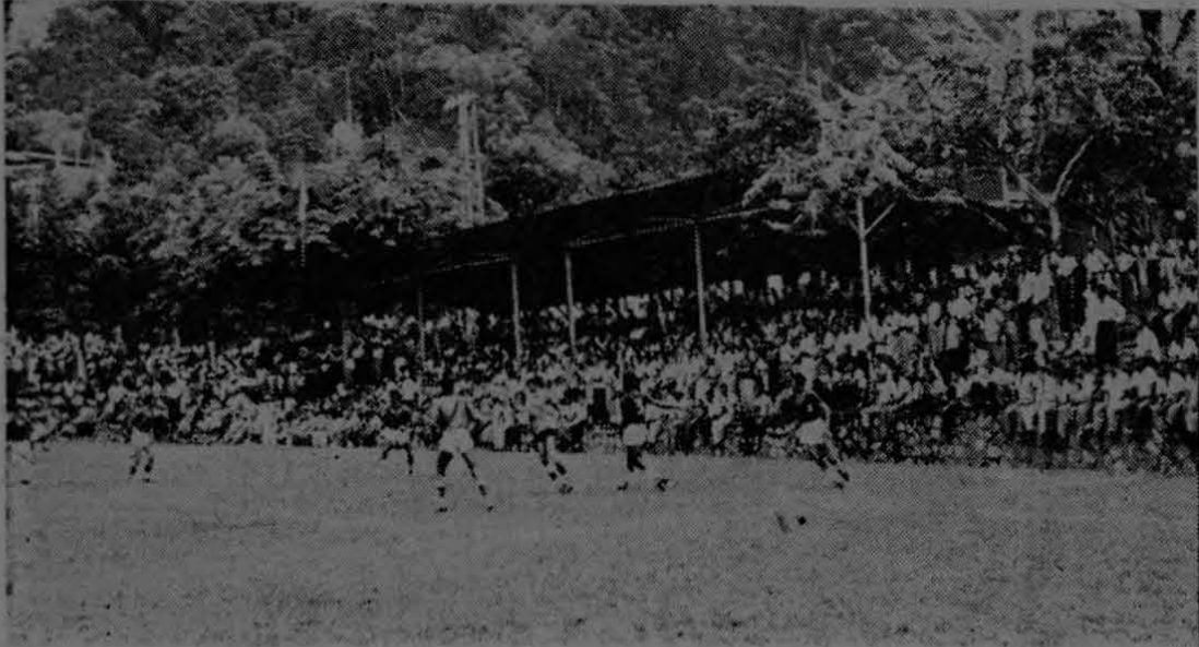
El 1º de mayo, Día del Trabajador, fue celebrado con grandes eventos sociales y deportivos en Golfito. La gráfica muestra una parte de la gran multitud de trabajadores, aficionados por el fútbol que se congregaron en las graderías de la cancha de Golfito, mientras que los equipos de Saprissa de Palmar y Coto 47 disputaban con ardor un evento amistoso. Más de tres mil personas tuvieron la oportunidad de estar en Golfito gracias a la colaboración de transporte que dio la Compañía Bananera. De Palmar, Sierpe, Puerto Cortés, Esquinas, Colorado, Coto, etc., llegaron a Golfito a disfrutar de un grandioso programa social y deportivo en los días 30 de abril y 1º de mayo.