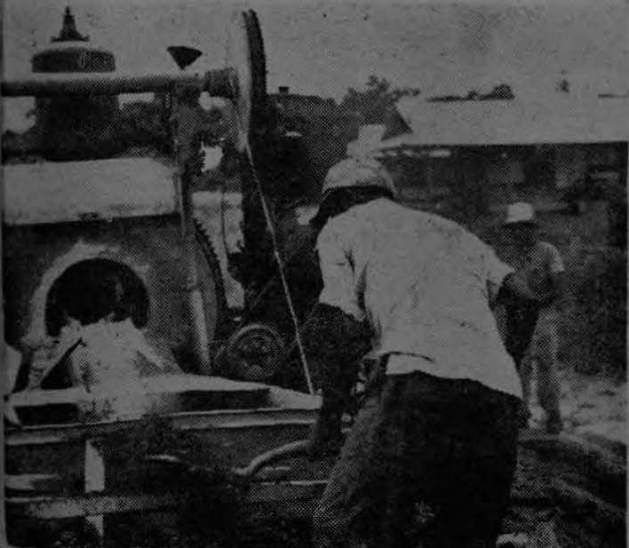
Uno de los trabajadores del Departamento de Construcción, Ingeniería de Coto, se empeña arduamente en su trabajo de construcción de las nuevas Fincas que se levantan en el Valle de Coto. Aquí vemos en plena actividad llenando la batea de la batidora de concreto.