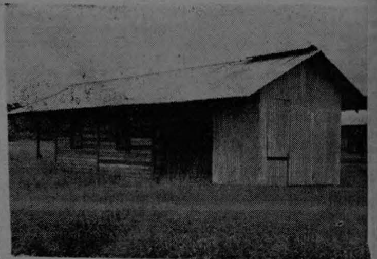
Muestra la fotografía con un poco más de detalle, una vivienda de tipo unifamiliar de las que ya se están construyendo en las nuevas Fincas del Valle de Coto. Estas casas prefabricadas, brindan una mayor independencia y comodidad a las familias de los trabajadores que las habitan.