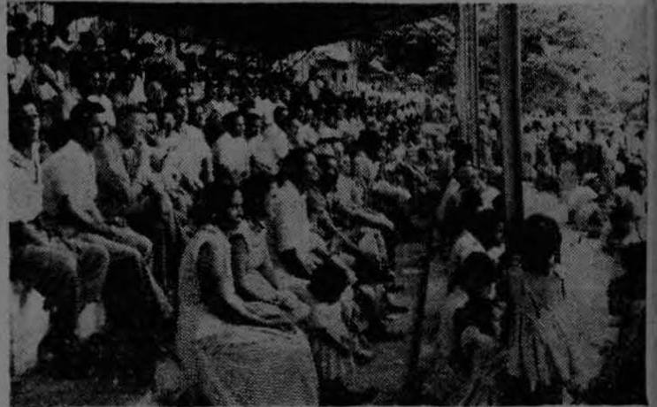
Otra vista parcial de la enorme multitud que llenó las instalaciones de la cancha deportiva y sus alrededores. Trabajadores de todas las Fincas de la División de Golfito y también de Colorado, estuvieron en la cancha de Golfito disfrutando de numerosos eventos deportivos celebrados el 1º de mayo de 1958. "Programas deportivos como estos son los que nos gustan, y sería bueno que sucedieran más a menudo", nos dijo un trabajador de Palmar Sur.