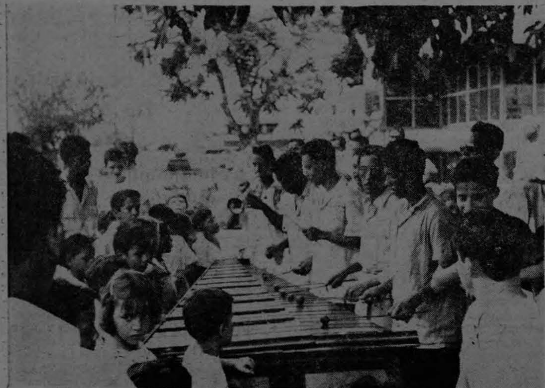
La Marimba "Maderas de Costa Rica" de Coto, vino a Golfito el pasado 1º de mayo a amenizar las fiestas que en honor a los trabajadores de la División se celebraran en este Puerto. Los marimbistas, todos buenos músicos, constituyeron uno de los mayores atractivos de los festejos.