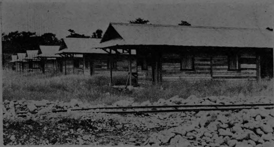
Muestra la fotografía un aspecto general de las primeras casas de tipo unifamiliar que se están construyendo en el Campamento de las Fincas 53 y 54 de Coto. Un total de 120 casas de este tipo, que son prefabricadas en los talleres de Palmar, serán construidas en los próximos meses, dando alojamiento a los trabajadores de las nuevas zonas de producción.

Con Ciento Veinte Casas Contarán Nuevas Fincas