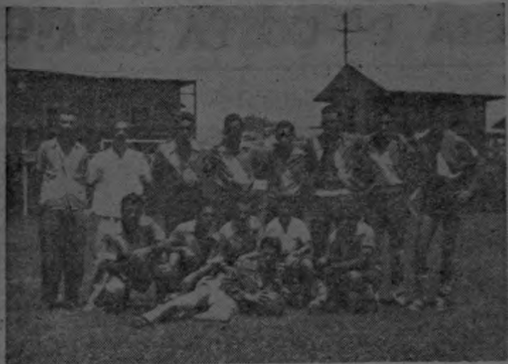
La gráfica de Murillo recoge al equipo subcampeón de balompié de la División de Quepos. Se trata del "QUEPOS F. C." cuyas actuaciones en las canchas costeñas ha sido muy destacada.