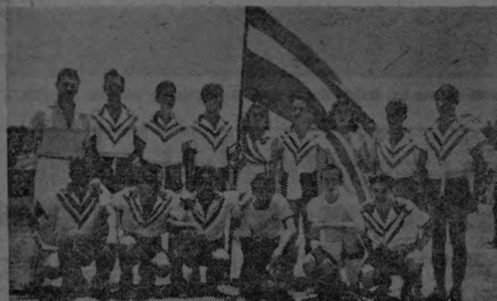
Juvenil "team" de futbol constituye el Costa Rica; técnica, clase y entusiasmo son los factos con que cuentan para la lucha por el campeonato de Limón.