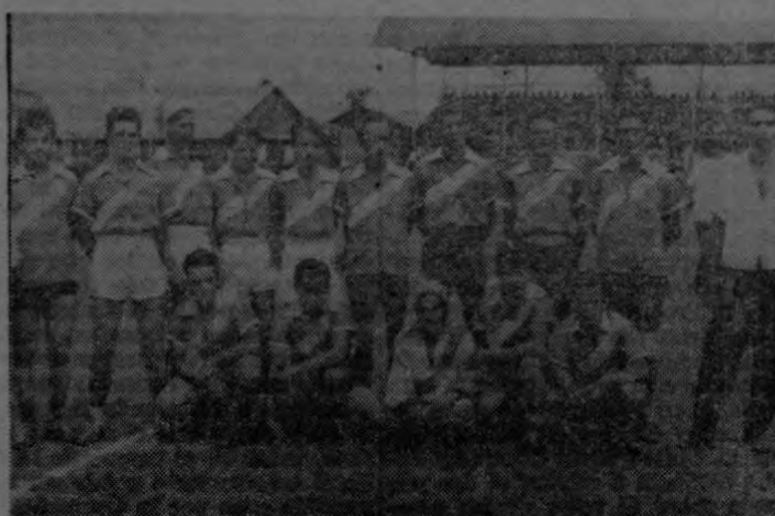
He aquí a los campeones de Finca 8, de Palmar Sur, quienes posan complacidos para nuestro reportero gráfico, León, quien nos remite la foto con ruego de expresar sus felicitaciones a los amigos de Palmar, felicitaciones que hacemos nuestras.