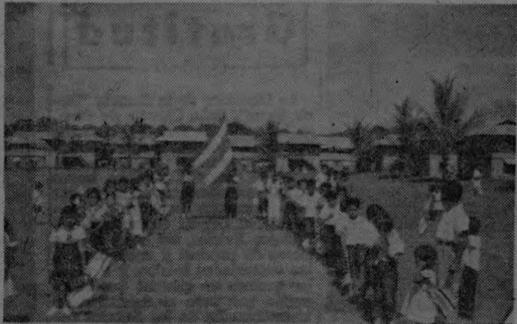
Esta espléndida foto fué tomada en Finca Silencio. Nuestro corresponsal gráfico captó el momento en que el alumnado de la escuela que tiene la Compañía Bananera de Costa Rica en esa finca de la División de Quepos, hacía en la mañana espléndida, su acostumbrado saludo a la Bandera Nacional.