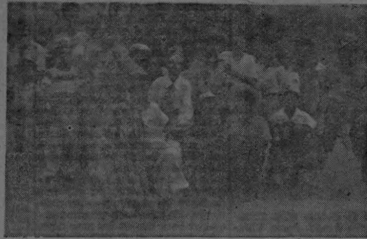
Este conjunto de alumnos de la Escuela de Esquinas, tomó parte en la fiesta infantil allí verificada. Vestidos de fantasía, cantan y bailan al son de sus guitarras.