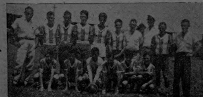
DAMAS, Noviembre.—Un fuerte cuadro balompédico que está midiendo domingo a domingo con los equipos más importantes de la zona sur, ha surgido aquí. La foto recoge al grupo de equipistas de "PLANTA DE ACEITE F. C."