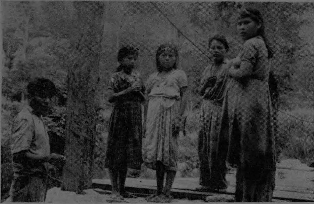
A indios Bri-Bri como éstos que aparecen en la fotografía que publicamos, es a quienes se ayuda efectivamente con la construcción del puente en forma cooperativista.