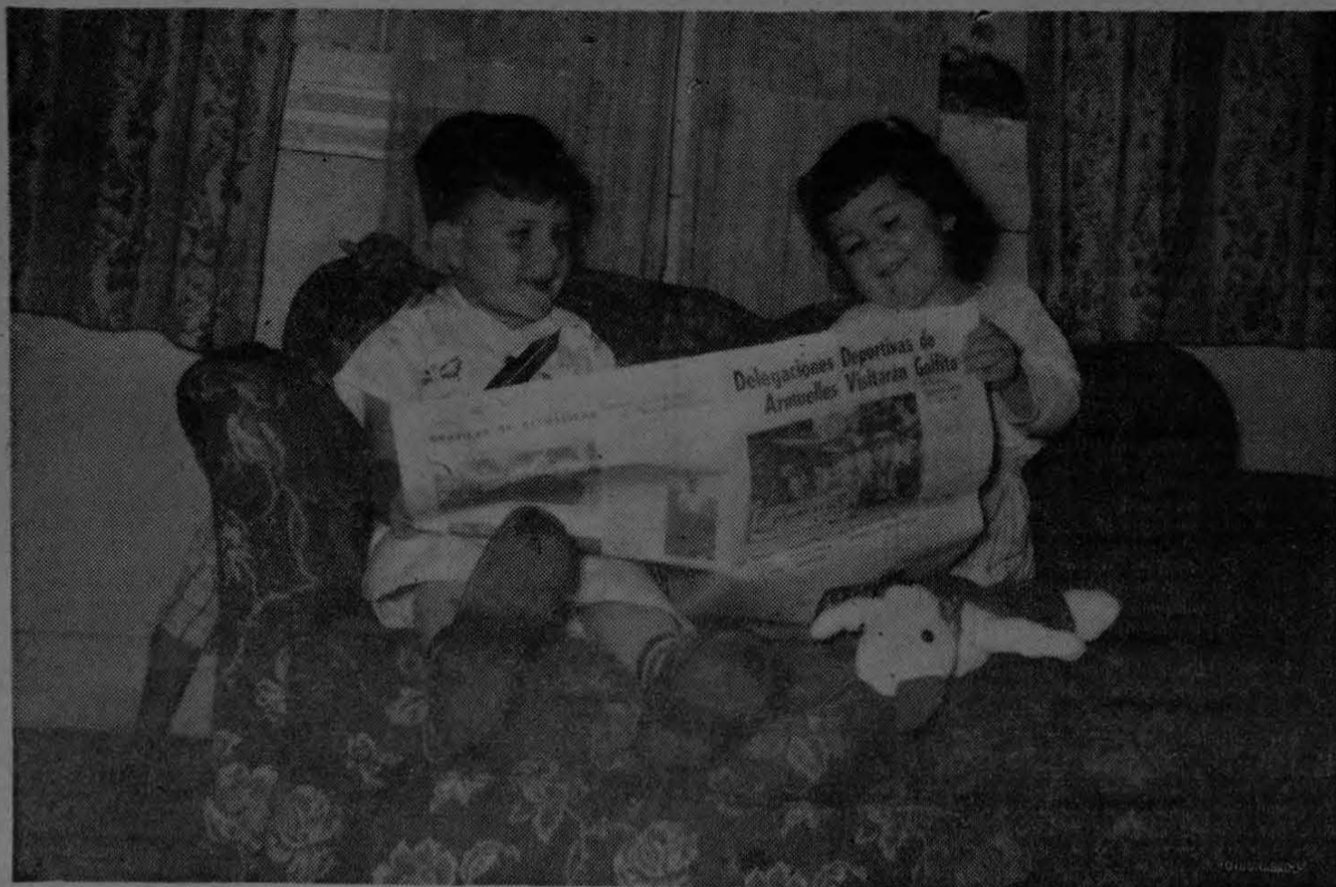
Un padre de familia que nos pidió mantener en reserva su nombre, nos envió esta fotografía en la que se ve a sus dos pequeños hijos "leyendo" con atención y cuidado "EL PACIFICO". Este periódico, que pretende ser amigo de todos y en especial de los niños, se honra en publicar la sugestiva foto.