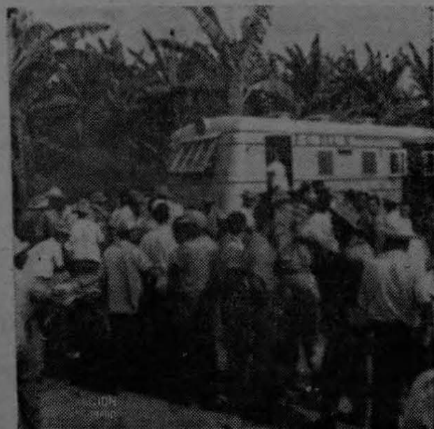
El carro pagador llega a cualquier finca a lo largo de la línea férrea. En todas ellas se ve la misma escena: caras sonrientes, "colas de trabajadores" que suben a recibir su pago, vendedores de periódicos y baratijas y allí, medio escondido, algún cobrador que no quiere dejar pasar la oportunidad de coleccionar su deuda...