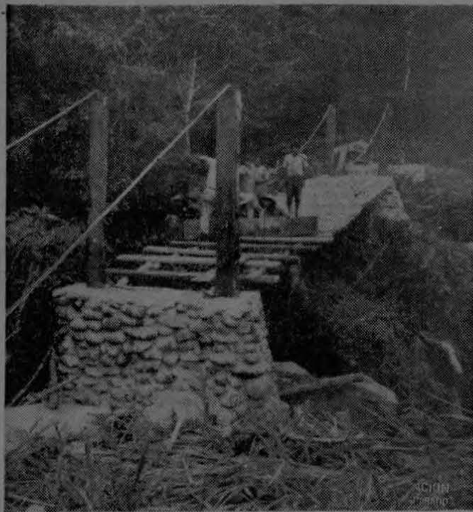
Este es el puente construido sobre el río Cobagra y que dará oportunidad a los indios Bri-Bri para que se comuniquen con el exterior del país, más civilizado. El afán de los indios jóvenes es poder asistir a las escuelas cercanas.