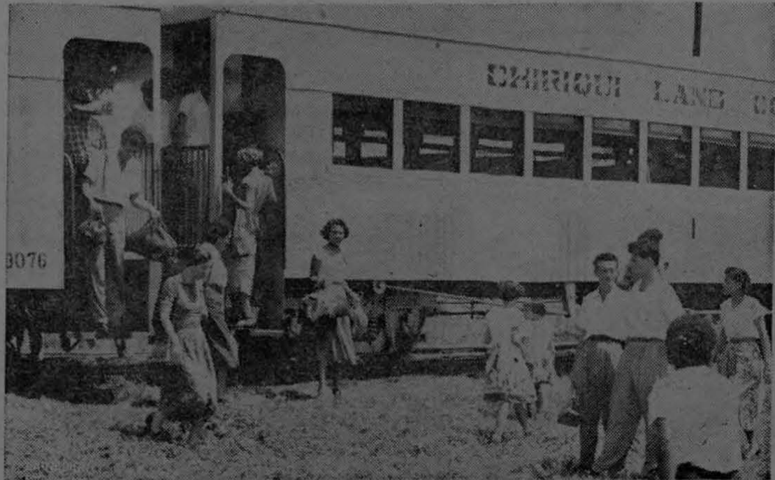
Los socios del Centro de Amigos de Golfito fueron en viaje de recreo, que dejó los mejores recuerdos, a Armuelles, en donde fueron atendidos espléndidamente por la sociedad de aquel hermano país. Aquí los vemos descendiendo del tren que los condujo a Puerto Armuelles.