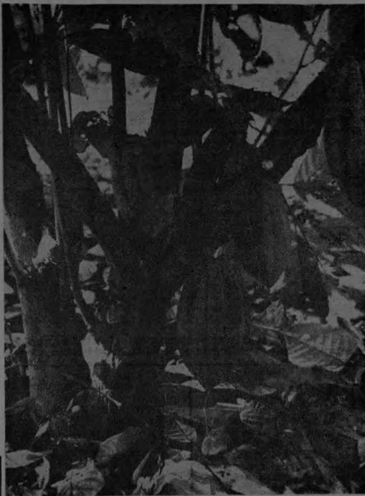
Este es un magnifico ejemplar de los cacaoteros que producen grano para la importante industria nacional.