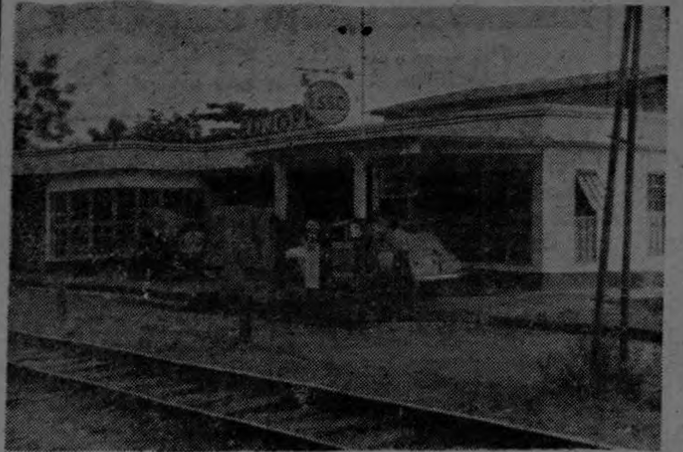
La población "civil" de Golfito está en constante desarrollo. Obras públicas y de bien comunal se realizan constantemente y la iniciativa particular no le viene en zaga. En la presente gráfica podemos apreciar la moderna bomba gasolinera "Rojofer" que con todas las comodidades de hoy día, presta sus servicios a los golfiteños. —