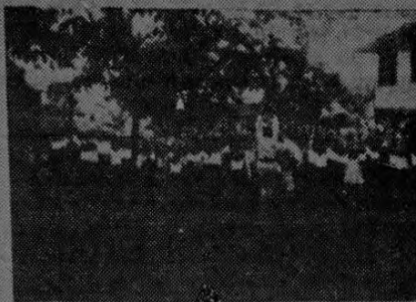
Los alumnos de la Escuela de Golfito hacen los ejercicios matutinos, dirigidos por uno de sus maestros.