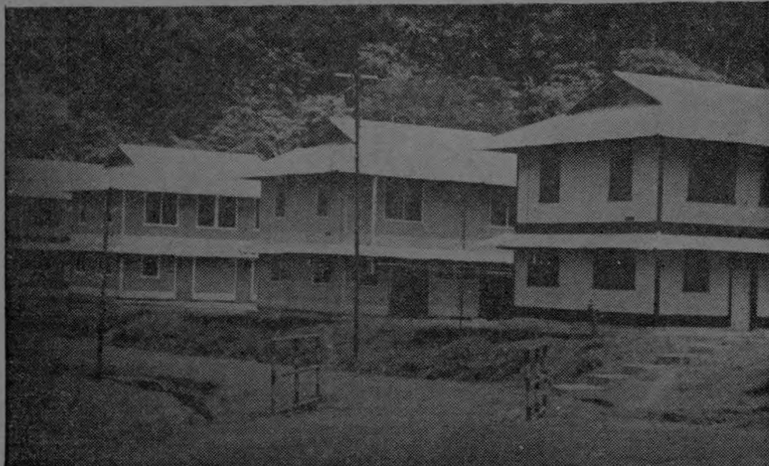
Seis nuevos edificios construidos por la Compañía Bananera en la Bolsa Nº 1 (Kilómetro 1-Golfito) son casas de las denominadas tipo "K", para dos familias, y ya están siendo ocupadas por trabajadores de la empresa, cumpliéndose el plan de la compañía, de dar alojamiento cómodo a sus trabajadores.