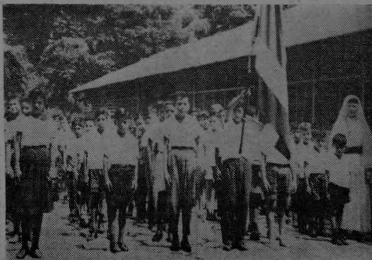
Posando especialmente para EL PACIFICO, alumnos de la Escuela de Kilómetro 1 de Golfito, son retratados en perfecta formación, encabezados por la Bandera de Costa Rica; una monjita cuida de ellos, posando al lado derecho.

Al consignarlo así, EL PACIFICO le hace llegar a los padres del niño y a éste, la más afectuosa congratulación.