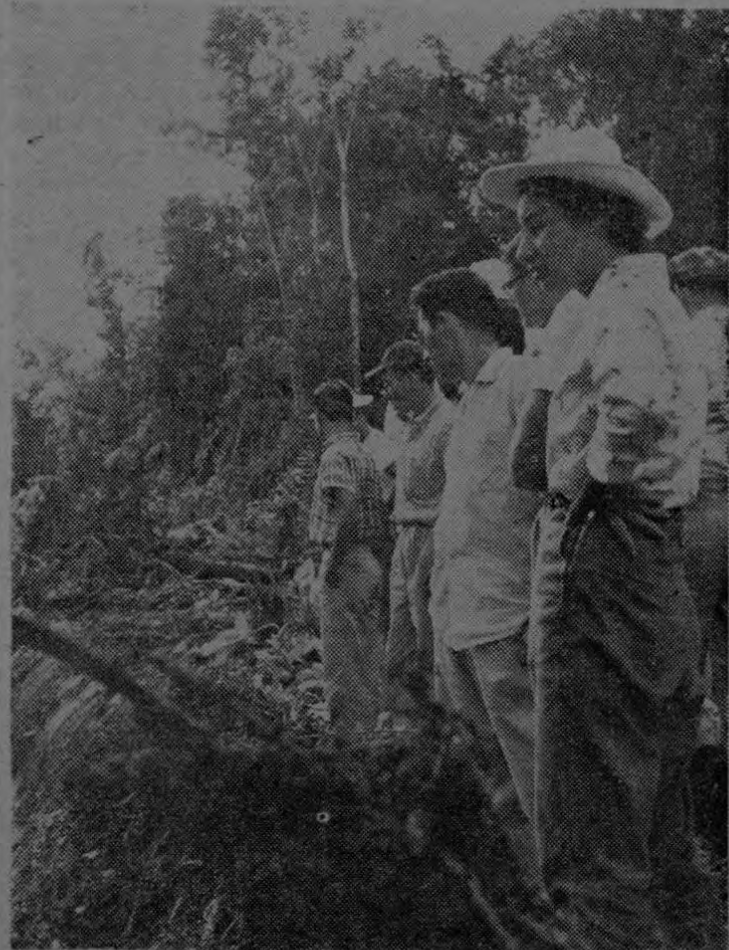
Los estudiantes del Quinto Año de la Facultad de Agronomía, observan la apertura de nuevas fincas en el Distrito de Coto.