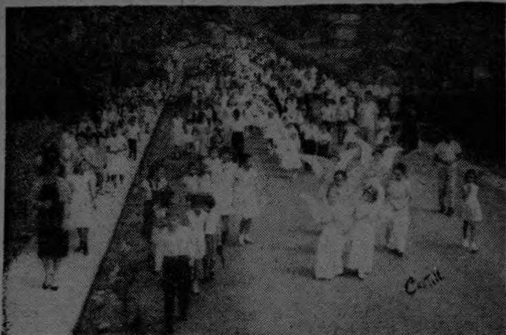
Vista parcial del desfile de ángeles y niños, que hicieron la Primera Comunión en la Iglesia Católica de Golfito el pasado 15 de agosto. Recibieron el Sagrado Sacramento 62 niños y 62 niñas.