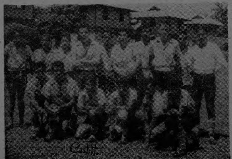
Equipo de futbol de la Finsa 43 de Coto, durante la inauguración del campeonato de futbol de 1959 en la cancha de deportes de Coto 47.