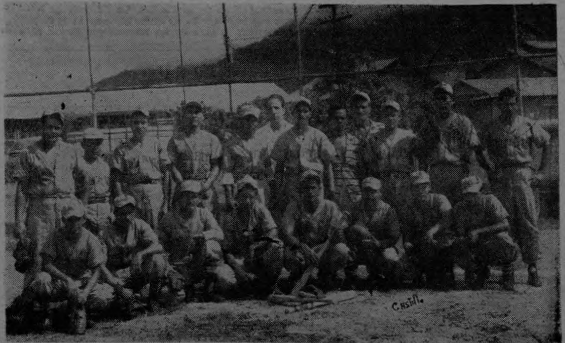
Este es el equipo de Golfito, en el diamante de Palmar Sur, pocos momentos antes de quitarle el invicto a Finca Puntarenas en el emocionante partido celebrado en Palmar el 23 de agosto pasado.