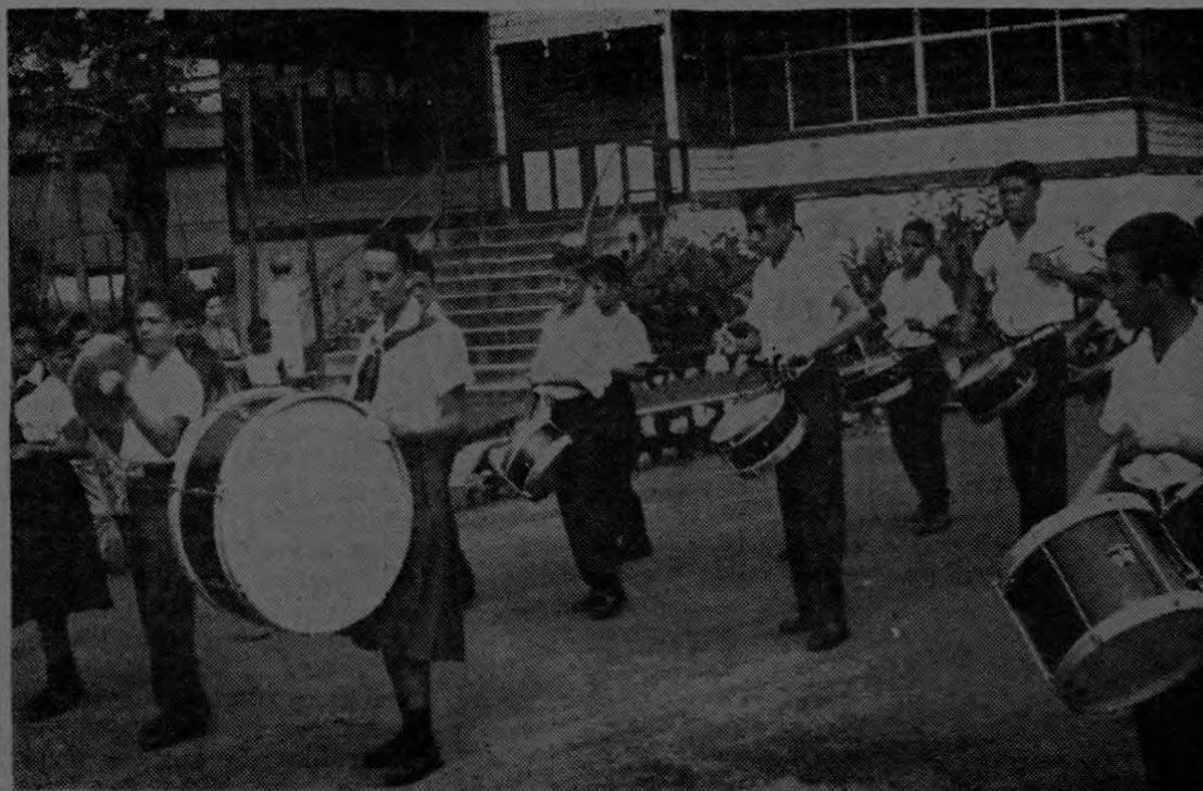
Magnífica fotografía de Castillo, tomada al cuerpo de tambores de la Escuela Central de Golfito, cuando desfilaban frente al Hotel Latino, el 15 de setiembre pasado, en uno de los actos conmemorativos de la fiesta de la Independencia Nacional. Causó muy buena impresión en el público la presentación de ese bien preparado conjunto de escolares.