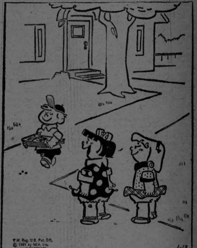
"¡Parece que se está empezando a fijar en las chicas!... ¡Cambió su colección de páginas cómicas por revistas de cine!"