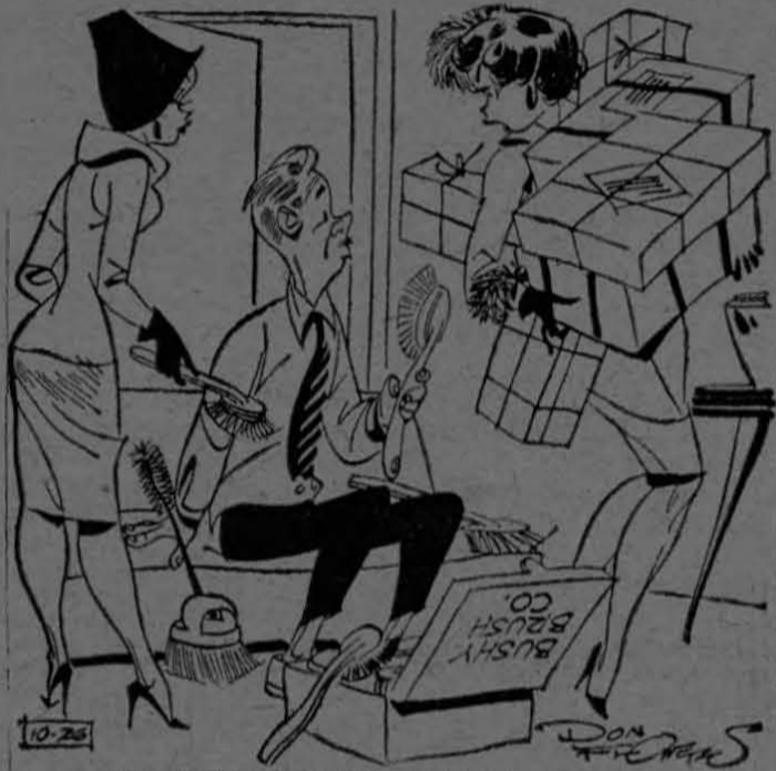
"¡Veo que llego a tiempo, marido! ¿Dónde están tus energías para sacudirte a los vendedores ambulantes?"