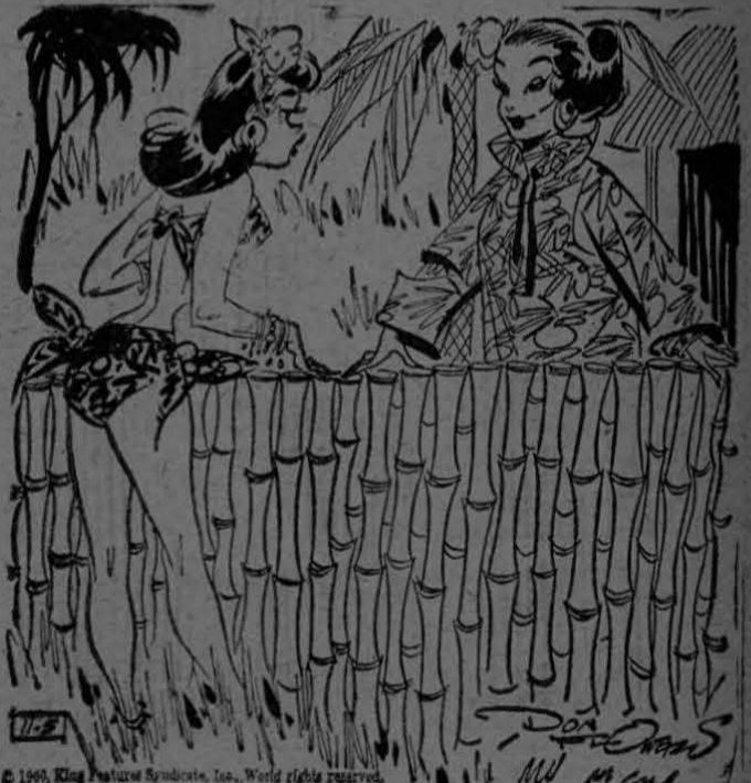
"Mi suegra viene a comer. ¿No sería posible que me prestara usted su kimono, vecina?"