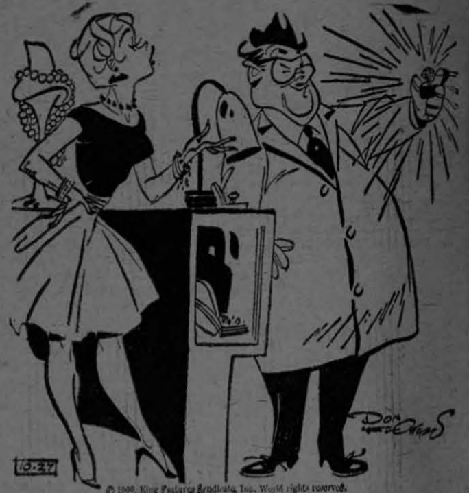
"Si usted me da permiso de que le haga una sugerción, primero muéstrele el anillo y después propóngalo el matrimonio."

—¡Qué! grita la chica palideciendo— Me ha hecho usted tomar... ¡pero si era para mamá!