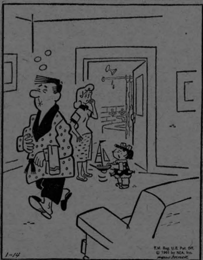
"Papá tiene mareos!... ¡Déjeme mi barco en la tina de baño!" (NEA)