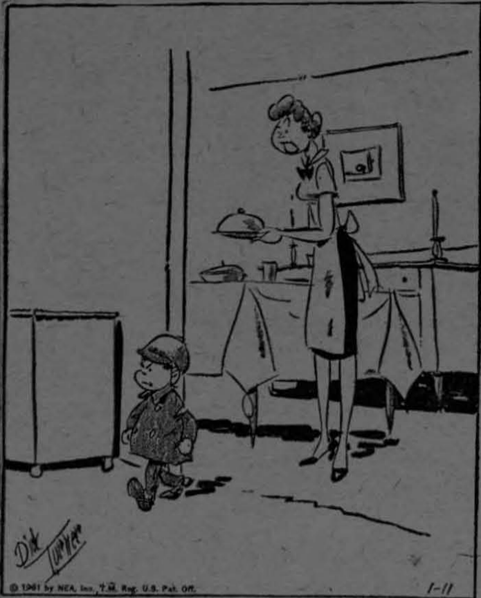
"¿Hijo, te divertiste en la fiesta? Sería mejor que me lo dijeras ahora... ¡porque lo voy a saber tarde o temprano!"