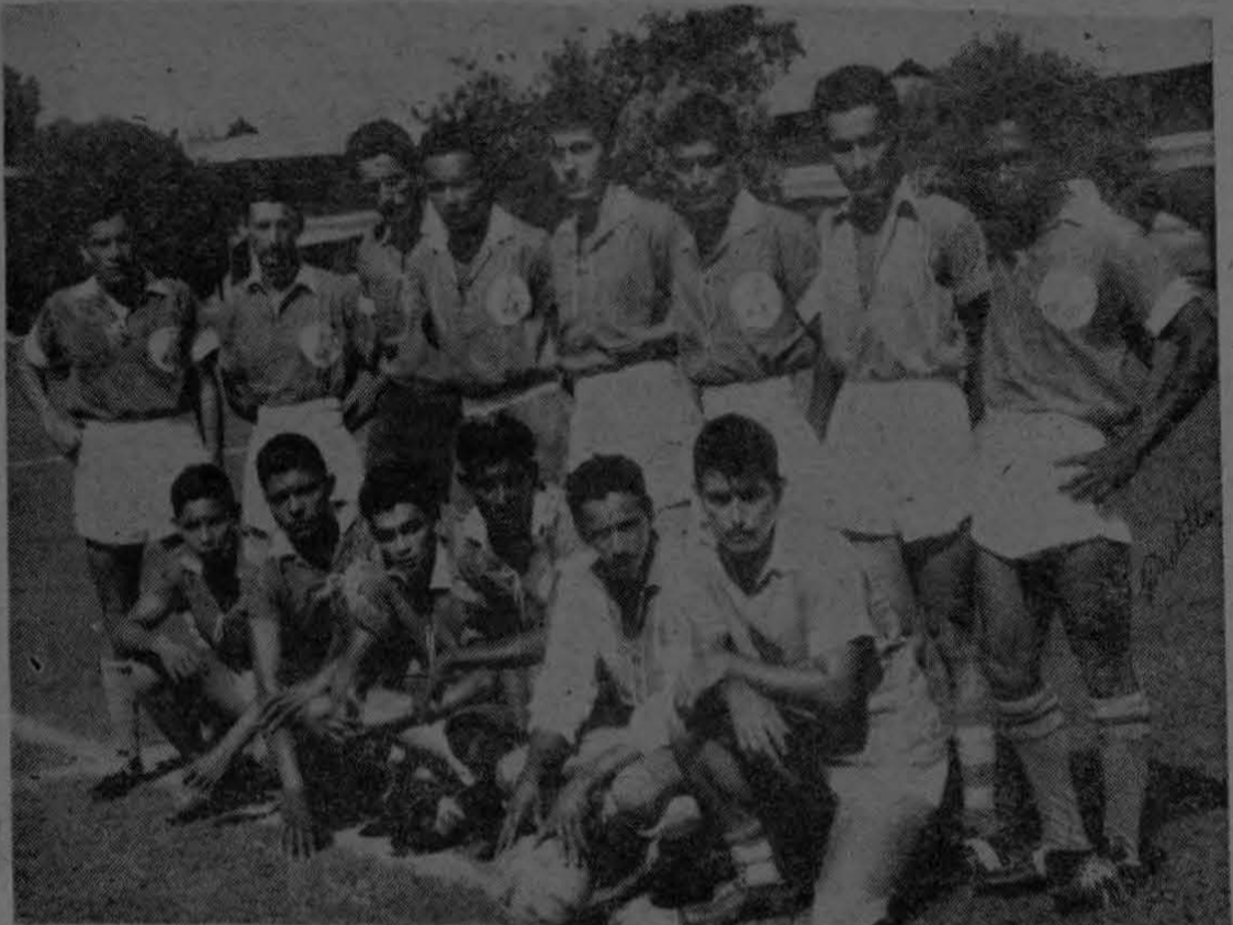
La presente fotografía corresponde al equipo de fútbol de Finca 45 de Coto, que en muy buena forma protagonizó encuentro de fútbol contra el juvenil "Boca Junior" de Coto 47, en la mañana del domingo 18 de diciembre p.p.d. Posa especialmente para "EL PACIFICO" en la cancha de Coto 47.— (Foto Castillo).