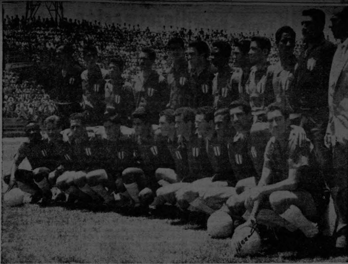
¡He aquí los Campeones invictos de Centro América y el Caribe!