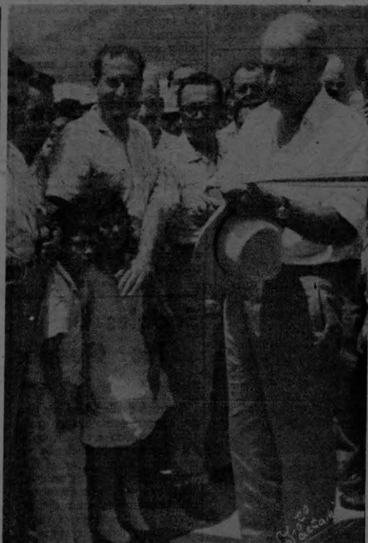
El señor Presidente de la República, Lic. Echandi Jiménez, captado por la cámara de "EL PACIFICO", en el histórico momento de cortar la simbólica cinta, al declarar oficialmente inaugurado el majestuoso puente sobre el Río Térraba, en Distrito de Palmar Sur, el domingo 26 de febrero pasado. Con un costo de un millón doscientos mil dólares y una longitud de 1120 pies, ha sido construido el más grande y costoso puente de Centro América, obra financiada conjuntamente por los gobiernos de la gran nación norteamericana y el nuestro.

men se jugaron los 2 primeros encuentros por el campeonato. A primera hora se enfrentaron Finca 2 vs. Finca 3; empataron 1 a 1. El segundo cotejo fue escenificado entre el campeón de 1959 Finca 9 y Finca 14; lo ganó Finca 9 por 2 tantos a 0. El saque de honor del primer match de la mañana tocó hacerlo al conocido deportista y buen amigo nuestro, Dr. Ladislao Robóz, en cuyo honor se jugó. Según la información que se nos suministró oficialmente, todos los domingos se jugarán tres encuentros; dos en las horas de la mañana y un tercero a las 3 de la tarde. Los aficionados al futbol en Palmar y fincas circunvecinas, después de bastantes meses de estar ayunando de tan gustado deporte, por lo que se ve, tendrán su plato favorito mañana y tarde. Muchas satisfacciones deseamos para la gran fanática del Distrito de Palmar, y las mejores felicitaciones para la Federación de Futbol.