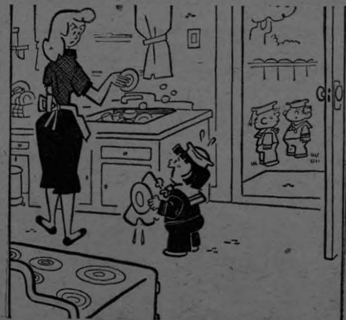
"¡Pero mi tripulación se va a amotinar, si ven que su capitán está haciendo de pinche de cocinal".