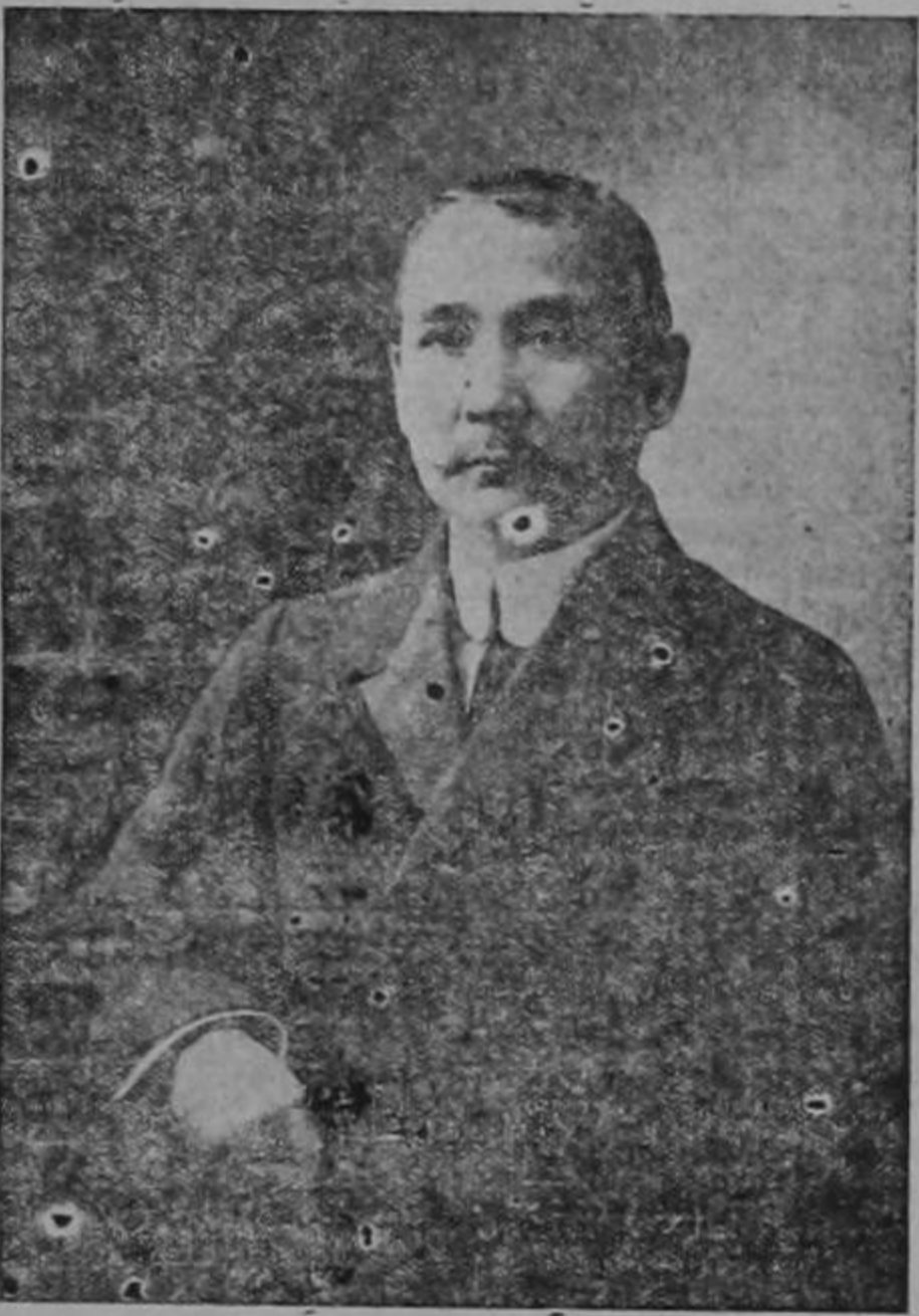
Dr. SUN YAT SEN Fundador de la República de China

EL PORVENIR dispuestos siempre a exaltar las grandes figuras que ocupan lugar prominente en la Historia por sus brillantes hechos en pro de la humanidad, no podrá dejar pasar inadvertida la fecha de hoy, en que la Gran República China celebra el 27 aniversario de su proclamación.