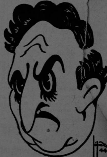
CALDERON A LA HORA DE CUMPLIR SUS PROMESAS