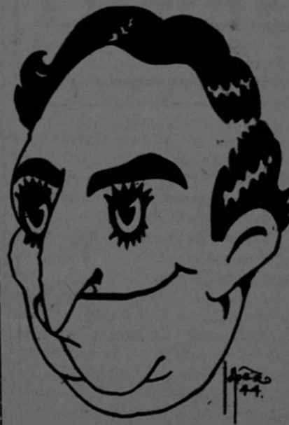
CALDERON A LA HORA DE PROMETER