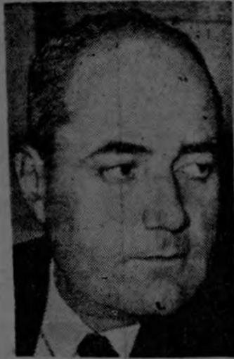
PRESIDENTE MARIO ECHANDI ... no dará golpe ...

Quienes conozcan mi trayectoria política y la de mis colaboradores en el Gobierno, y el definido criterio que tenemos sobre el respeto que a todos debe merecer el precepto constitucional de la división de los Poderes no pueden imaginarse por un minuto siquiera que hayamos pensado alguna vez en atentar contra la majestad de las Constituciones o el fuero de los diputados rompiendo el orden jurídico y dando un golpe de Estado, "dijo ayer para "EL TIEMPO DE COSTA RICA" el Presidente de la República don Mario Echandi Jiménez. Y continuó expresando: