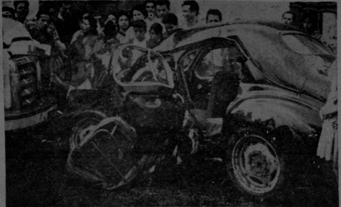
EFFECTOS DEL CHOQUE. El taxímetro placa 2378, embestido por el bus de Santa Ana N° 6694, quedó absolutamente destrozado. El chofer resultó gravemente herido.

público quedara perfectamente enterado de su estructura modulada "a la italiana". En cuanto a sus genialidades es necesario decir que no abundaban. Sus danzas "exóticas" lo fueron por la cursi melodía de "Un mercado persa". Después... ondulaciones y más ondulaciones, sugerencias... más sugerencias y —fundamentalmente— garrafales errores lumínico-técnicos que deslucían el espectáculo. Esta graciosa polaca llevaba su oficio de bailarina como una excusa para exhibir su cuerpo hermosísimo. Su simpatía personal se ganó al público a pesar de no saber una palabra de español. La cubana Simaya es un grito popular sentido y con un tremendo sabor de tragedia rayana en lo helénico. Mujer fea y hoy