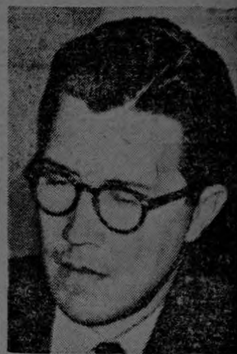
MINISTRO VARGAS GENE

Como final cabe recordar, y hacer hincapié, en el hecho importantísimo de que la reforma penitenciaria a proponer por el Consejo de Defensa Social, cuenta ya con los fondos necesarios para ser puesta en inmediata ejecución".