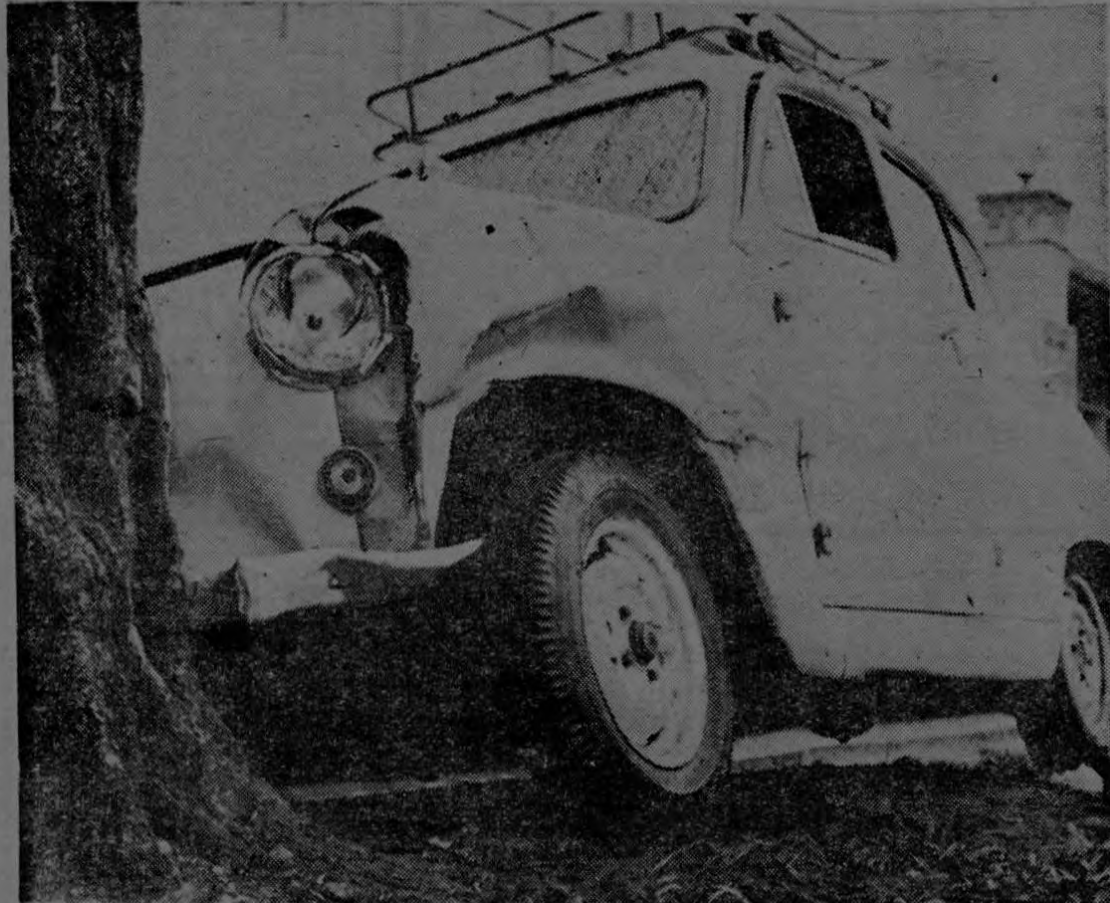
JOVEN LESIONADA: En el taxímetro 3450 que aparece en el grabado, resultó lesionada una joven a quien las autoridades de tránsito no habían identificado. El carro se estrelló contra un árbol frente al Hospital Central del Seguro Social a las nueve y treinta horas de ayer. No se ha determinado qué persona guiaba el taxímetro. Existe la impresión de que lo ocurrido fue un choque.

Se procedió al decomiso porque según se enteró a la autoridad juzgadora, el dueño del arma es persona de malos antecedentes que se ha visto envuelto en varios lios.