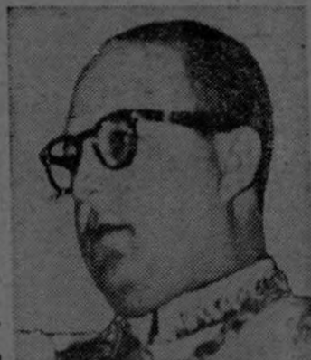
MARCOS PEREZ JIMENEZ ...Invadirá?...

A sólo dos semanas de la fecha fijada para las elecciones las noticias de una posible invasión han traído desasosiego en todos los círculos, y se cree posible que todos los partidos políticos organicen una manifestación de apoyo al Gbno. provisional.