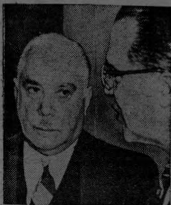
RAFAEL L. TRUJILLO ...ayudando...