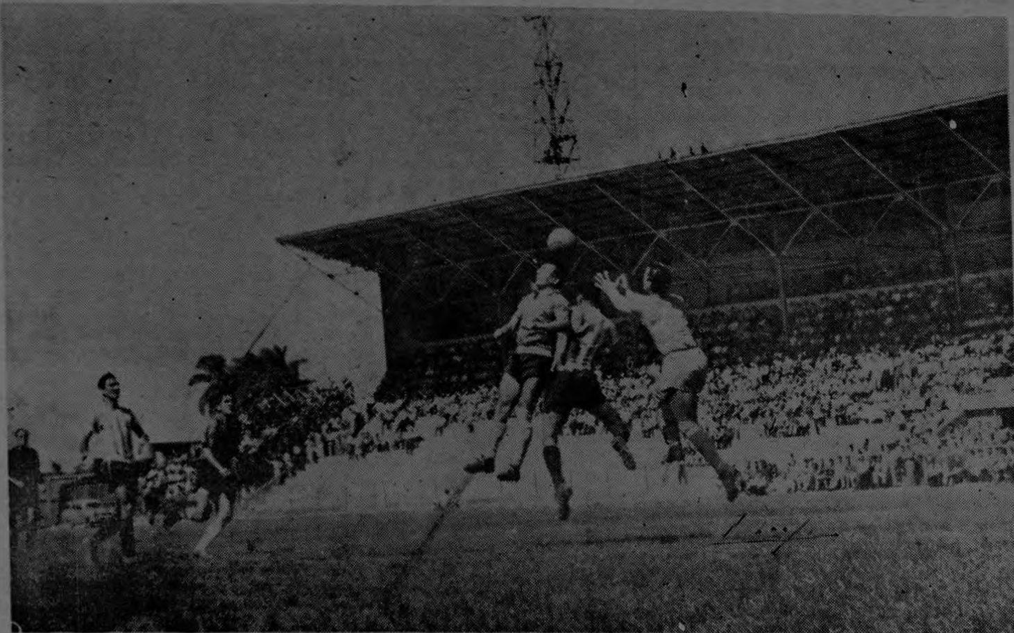
Los manudos lograron el empate mediante una jugada magistral de las pocas que se vieron en el flojo partido internacional de ayer. Un balón filtrado por Cuca Herrera sobre la valla brasileña obligó al arquero Ubirajara a salirse buscando rechazar de puños, pero el puntero izquierdo local le ganó el viaje entrando a rematar de cabeza metiendo la pelota en la valla carioca en forma perfecta como podrá apreciarse en esta espléndida gráfica.

CARACAS (SE) Siguen llegando las delegaciones de los distintos países del circuito centroamericano y del caribe a los Octavos Juegos Deportivos. La representación costarricense arribó en vuelo regular de la PAA formada por veintiseis personas. En el Aeropuerto Internacional estuvieron a recibirlos autoridades olímpicas y miembros del Comité Organizador. También estuvieron presentes gran cantidad de costarricenses radicados en esta capital. Fueron después trasladados hasta su alojamiento en el Hospital Militar donde quedaron cómodamente instalados.