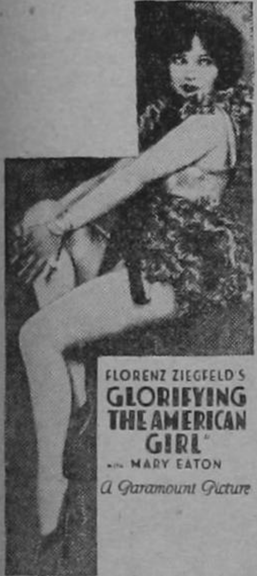
FLORENZ ZIEGFELD'S GLORIFYING THE AMERICAN GIRL with MARY EATON A Paramount Picture

Podemos asegurar que Glorificando la Muchacha Americana será sin duda alguna el éxito más grande del año.