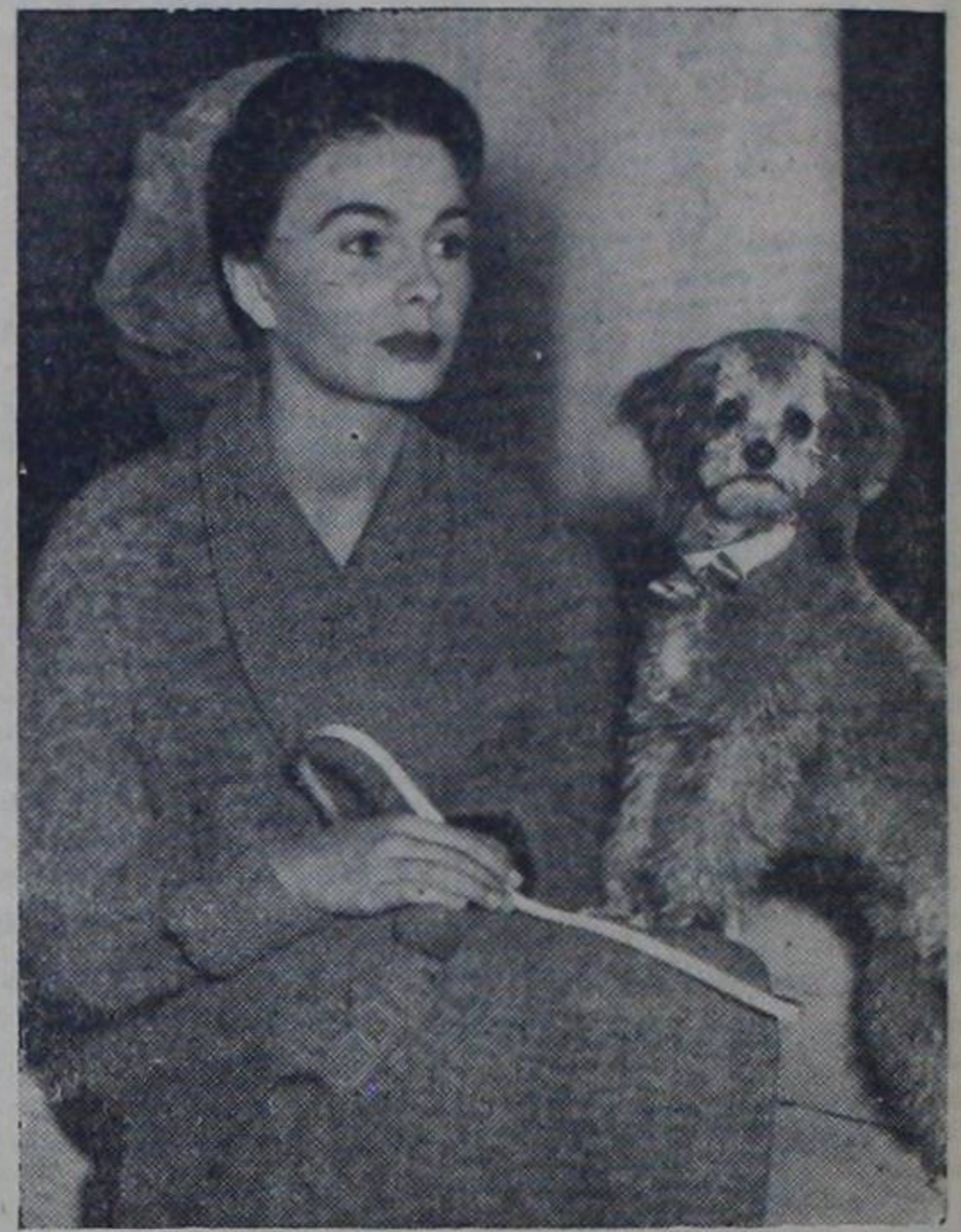
Esta bella periodista viaja por el mundo recogiendo "burradas" para escribir un libro muy sugestivo.

Su monomanía por derrochar dinero no conocía límites. Poseía una finca en Nueva Jersey, don-