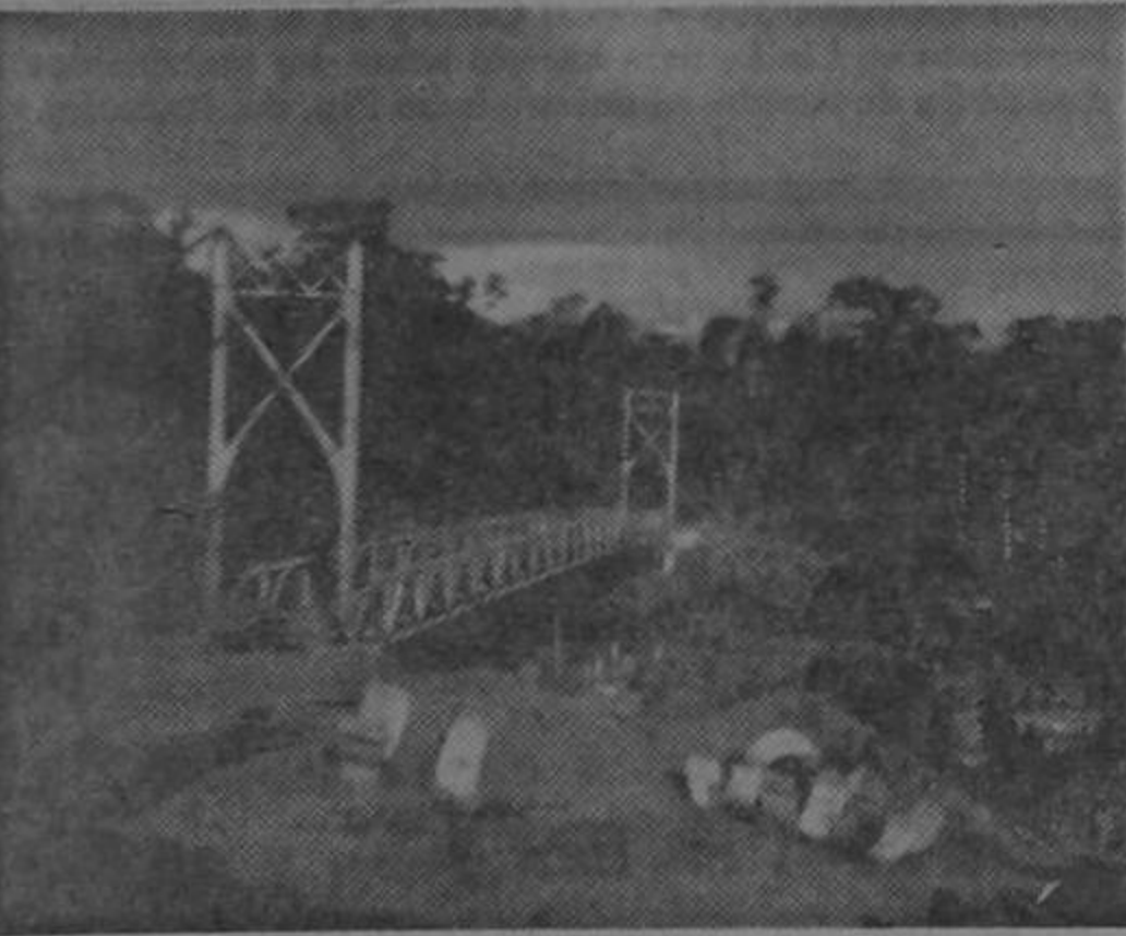
PUENTE SOBRE EL RIO TORO AMARILLO.— De aquí se extiende la carretera hasta ahora de seis y medio kilómetros que llegará a unir a Guápiles con la provincia de Cartago. La obra se está llevando a cabo con el aporte económico de ambas municipalidades.