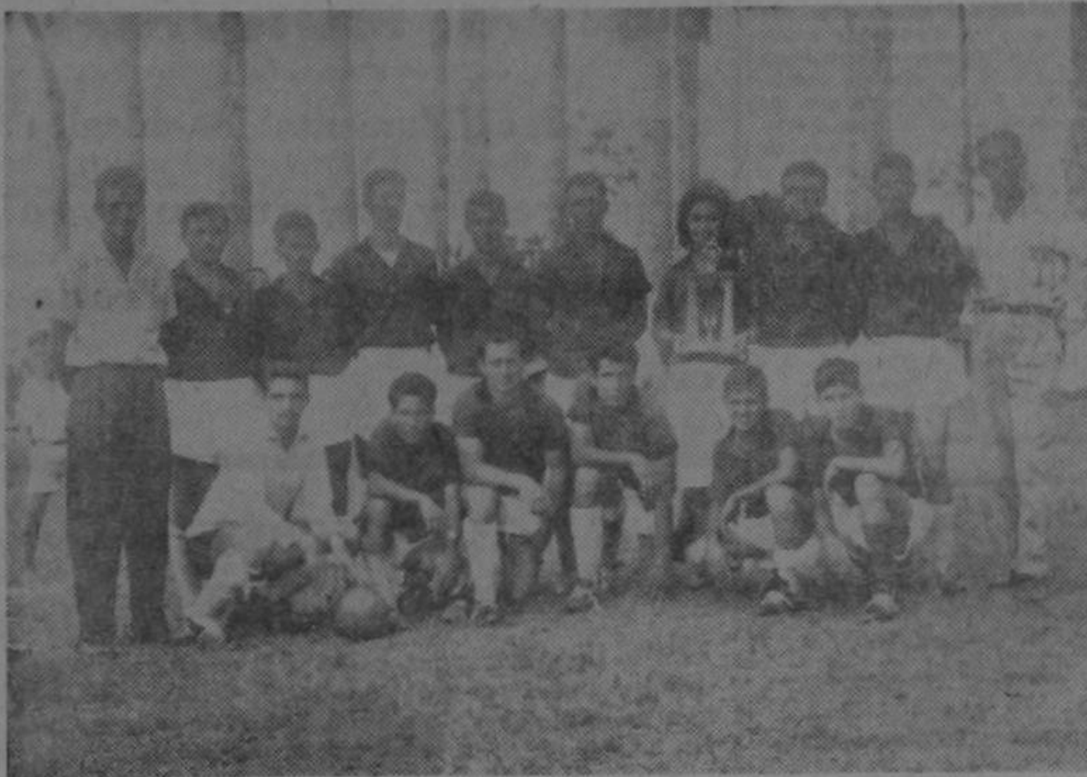
PODEROSA ESCUADRA de fútbol de Guápiles. Pococi F. C. Campeón invicto de 1962. A la cabeza en el presente torneo futbolístico, de dicho cantón. Exponentes de una excelente calidad de fútbol. Este magnífico