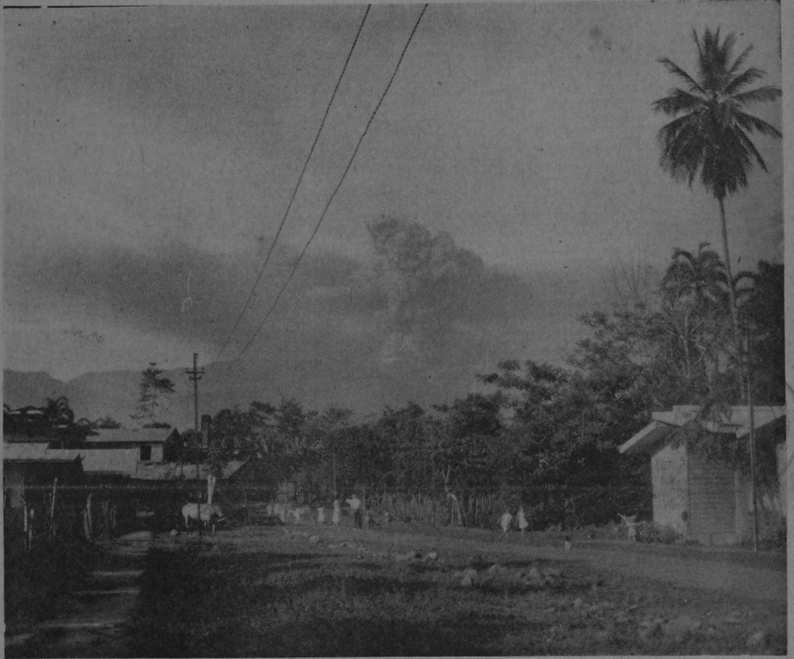
RINCON DE COSTA RICA.— En la belleza del paisaje campestre se destaca el Volcán Irazú en plena erupción. Esta es una de las primeras fotografías que la prensa nacional publica de las erupciones del Irazú, tomadas desde otro ángulo de nuestro territorio.