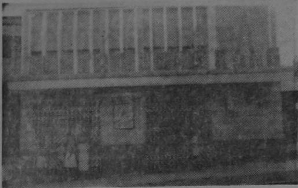
Teatro Hong Kong de Limón