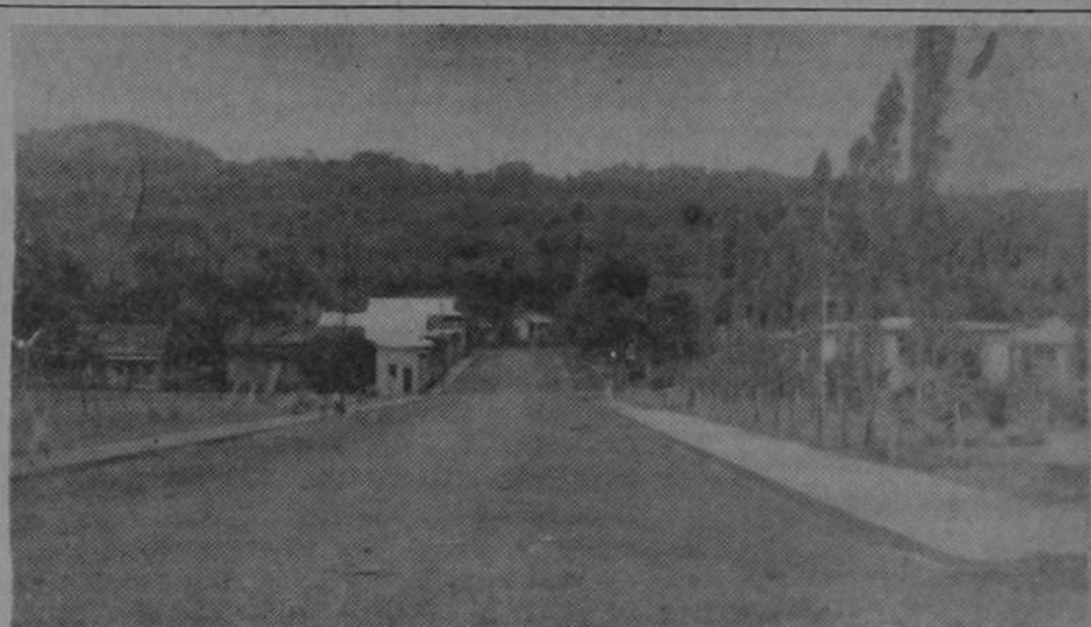
En la presente gráfica, comienzan a plasmarse las aspiraciones de toda una región, carretera que los conducirá a San José.

Comentario especial merece este acto que, por vez primera en Limón, atraerá a numerosos y distinguidos elementos de la docencia nacional. Participarán en el mismo profesores de los siguientes colegios: Colegio San Luis Gonzaga, Colegio Vocacional de Siquirres. Pasa a la Pág. CINCO