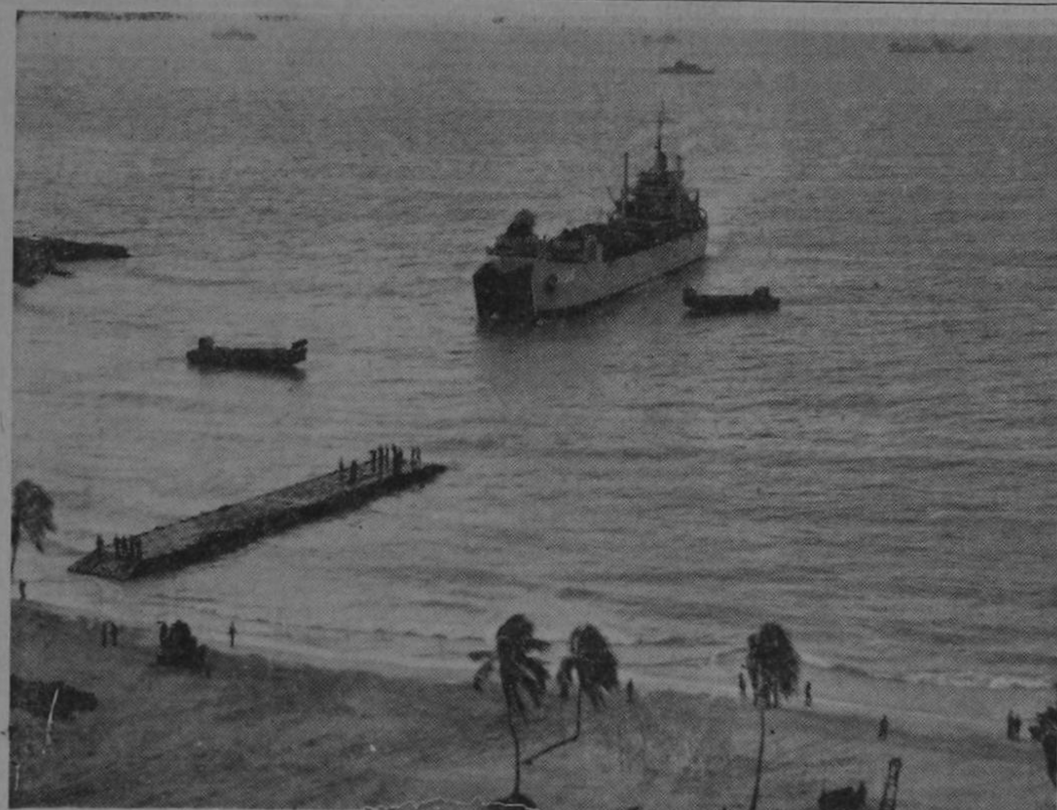
"USS TALBOT COUNTY", diseñado para el desembarco de tanques de tipo mediano y apoyo a las tropas de desembarco descansa en la Bahía de Limón en breve visita que realizó esta semana a nuestro Puerto del Atlántico.