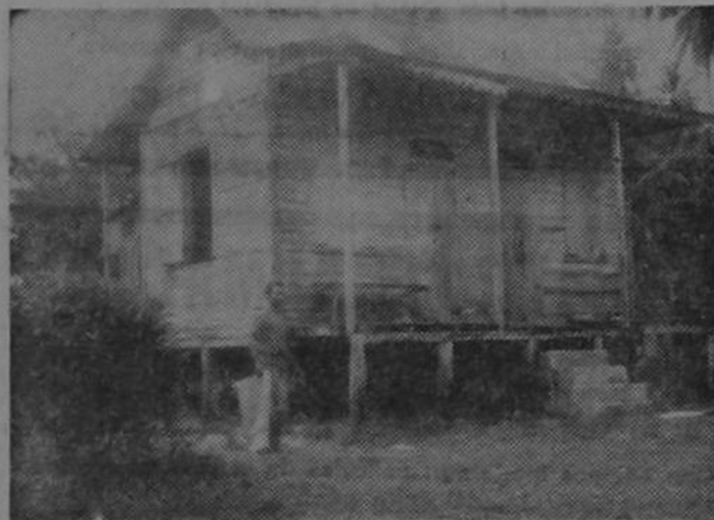
Una casa típica de la región. Basas muy altas, una escalera de cemento y paredes maltrechas, sin pintura, llenas de agujeros indiscretos. La vida apacible no necesita mejores viviendas que como éstas.