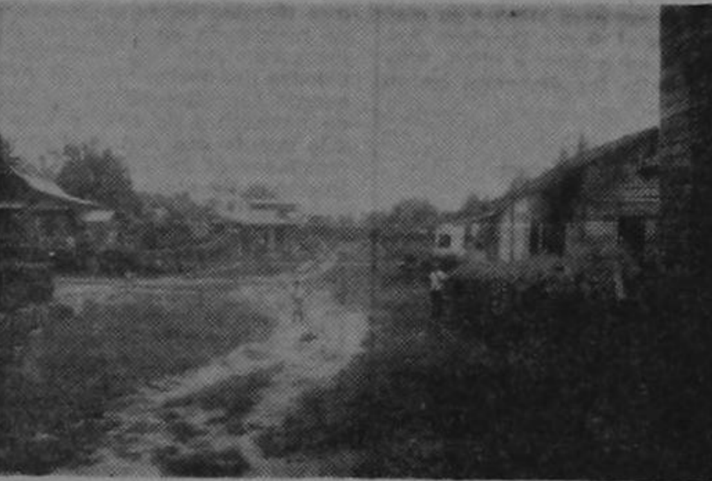
La calle principal de Cahuita, en una mañana desprovista de sol. Las calles son archas y espaciosas. El cuadrante puede notarse con exactitud y las casas que dan abrigo a estas gentes de trabajo. Al fondo de la calle queda el Mar Caribe en toda su bravura.