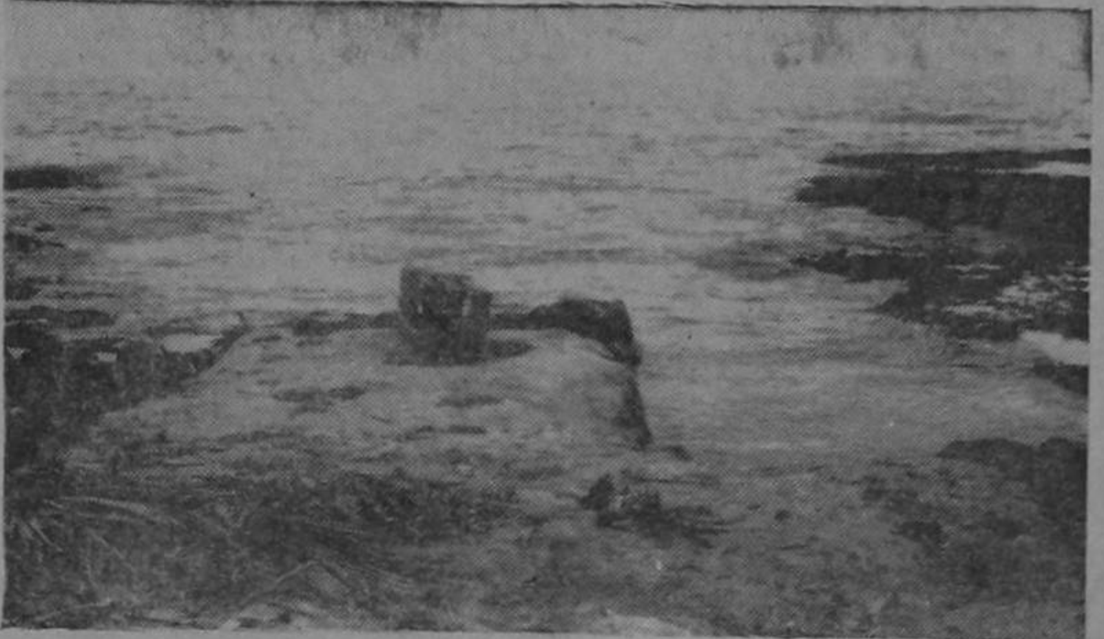
Este es el muelle de Cahuita. Una caja abandonada marca la existencia de un atracadero muy primitivo, sin nin-