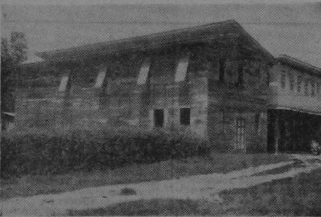
El Teatro Lam exhibe películas tres veces a la semana, y el público asiste satisfecho del espectáculo. Al fondo, está el precioso hotel que el señor Lam a los turistas. Un hotel con todas las comodidades más modernas que usted nunca creería encontrar en esa región.

Y viene el cacao. Hay fincas por todas partes. Las hay grandes, de 100 hectáreas; las hay pequeñas, de una o dos hectáreas. Las que más abundan son las que fluctúan entre diez y treinta hectáreas. Se da el caso de que el suelo está muy distribuido entre gente pobre, puesto que, en relación con las posibilidades del medio, hay más de 250 terratenientes, lo que es un verdadero éxito socio-económico. Todos trabajan en su explotación, ya de peones en otras parcelas, ya de propietarios en sus propios terrenos. Cuando el precio del cacao desciende, o cuando sube; cuando, en suma, varía como lo hace en forma tan inesperada, la población entera marca el ritmo de ese valvén comercial que repercute directamente en las cocinas de cada casa.