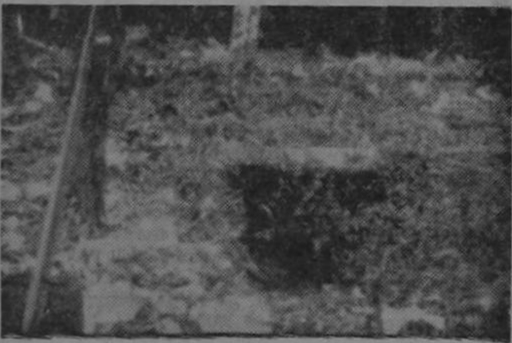
He aquí un hermoso pozo de agua potable. Nótese que la maleza todo lo cubre, y que más parece una cueva que un centro de salud. Así son todos; las aguas cenagosas son apartadas con la mano para recoger lo que a simple vista parece claro y limpio. Muy bien por la sanidad de la provincia.