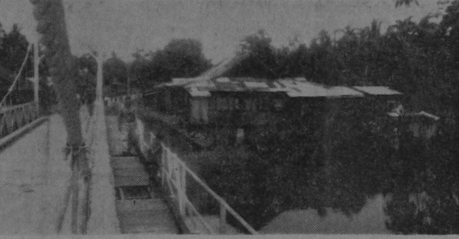
Puente de Cieneguita, en Limón. Como la vía es muy angosta, tiene pasarelas a ambos lados para que el peatón camine tranquilamente. Obsérvese dos descarnados huecos que dan a las aguas del río. De no arreglarse semejante desperfecto, tendrán que colocar botes de emergencia, o un aviso que no se responde por quien pase por allí.