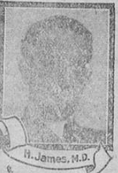
H. James, M.D.

El doctor James, que perteneció al servicio de Higiene Pública de los Estados Unidos, dice: "Los pacientes en cantidad del Hierro Nuxado, en mi opinión, me enervada, por ejemplo, los convalescentes de fiebres prolongadas, los anémicos de larga fecha, necesitan todos, en mi opinión, hierro. De poco acá se me ha llamado a la atención hacia el Hierro Nuxado. En la práctica lo hallé magnífico restaurativo y agente ideal para reponer las fuerzas en los casos que dejo mencionados." NOTA.—Hierro Nuxado, prescrito y recomendado según se ha visto por los médicos en tan gran variedad de casos, no es medicina de patente ni remedio secreto, sino artículo bien conocido por los droguitas y cuyos constituyentes de hierro son muy reconocidos por eminentes médicos tanto europeos como americanos. Al revés de otros productos de hierro inorgánico, es de fácil asimilación y no perjudica la dentadura ni la engrosce, ni descompone el estómago; antes bien es remedio potentísimo para casi toda forma de indigestión, como también para condiciones de nerviosidad y extenuación. Tal es la confianza de los fabricantes en el Hierro Nuxado, que ofrecen entregar $100.00 a cualquier institución caritativa siempre que a cualquier hombre o mujer faltos de hierro no les acreciente la fuerza en un 200 por ciento o más en un período de cuatro semanas, a no ser que tengan algún desorden crónico grave. Todos los buenos droguitas de esta lo despatchan.