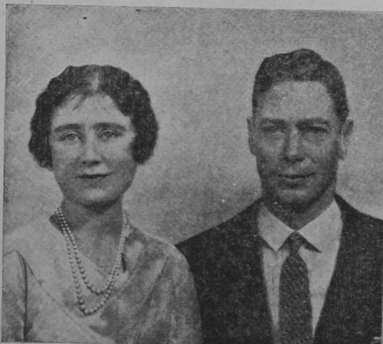
Los nuevos reyes de Inglaterra, Jorge VI y su esposa la reina Isabel, hasta ayer Duques de York, que serán coronados próximamente.

MADRID, 12. UP — Las baterías nacionalistas arreciaron su fuego contra los barrios céntricos de esta capital, como señal de que se está preparando un nuevo ataque de esperada para capturar Madrid. Varios combates de infantería se están desarrollando sobre un extenso frente alrededor de la capital y las tropas nacionalistas avanzaron bajo la protección de la cortina de proyectiles arrojados sobre las líneas gubernamentales. Las tropas milicianas están haciendo un esfuerzo supremo por detener el empuje de las mejores tropas del general Franco, y las bajas en ambos ejércitos están subiendo rápidamente. Los nacionalistas trasladaron con urgencia refuerzos al sector de Gualajara, donde los nacionalistas han iniciado una segunda ofensiva.