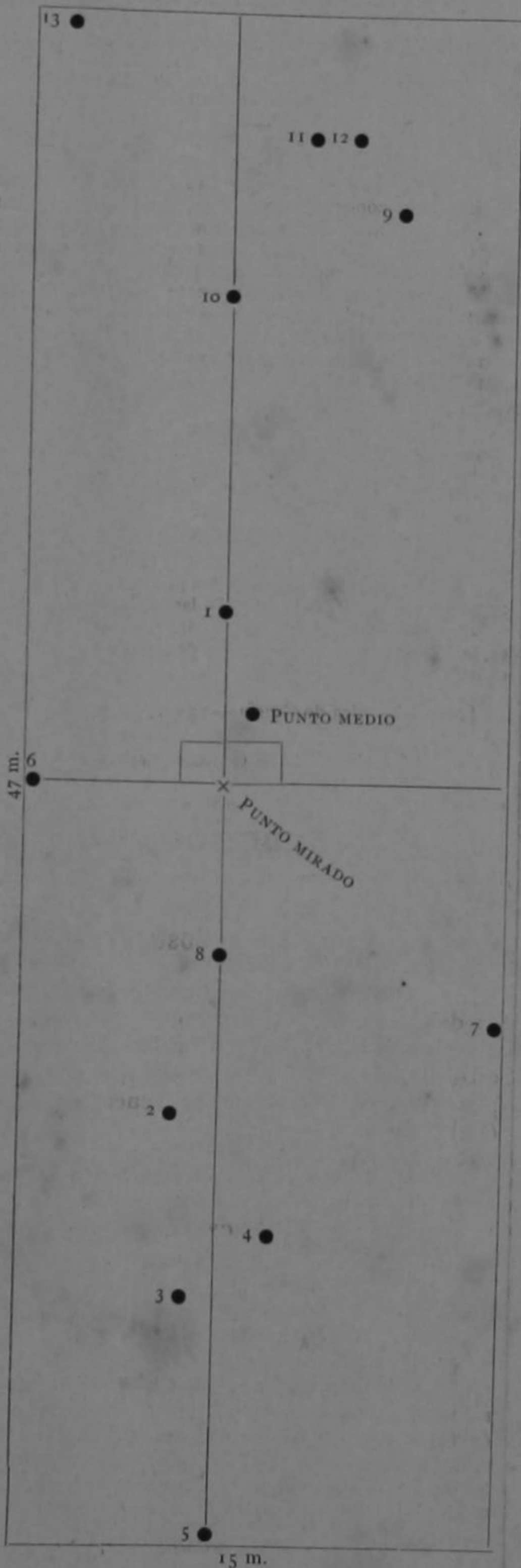
Escala: 5 m / 7 = 1 m.

Según la dispersión probable de los proyectiles á esta distancia, el rectángulo teórico debería ser de 76 m. de largo por 14 m. de ancho; así es que la dispersión en alcance que obtuve en mi tiro fué inferior á la teórica, es decir á la indicada por las tablas de tiro; y la dispersión en dirección fué mayor de 1 m. á la teórica ó sea á la indicada en las tablas de tiro, pero esta dispersión lateral fué debida al viento que al principio del tiro molestó considerablemente, soplando mucho y cambiando de dirección á cada momento, razón por la cual, el Jefe de Sección tuvo que mandar á hacer varias correcciones en la deriva.