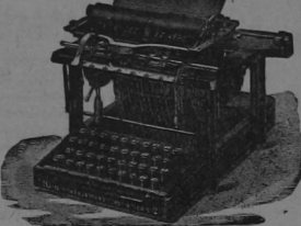
Remington... $ 40, 45, y 50 al contado $ 45, 60 y 65 plazos Primer abono $ 10 y 10 centavos.