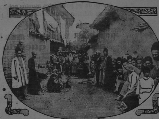
Escena en una calle de la ciudad de Fabriz, en donde la agitacion contra Rusia ha tenido más violentas manifestaciones.

—Hubo quien se propusiera a detener el negro para presentarlo a la autoridad. —Pero, imposible; hayó como galgo, y hasta la fecha.