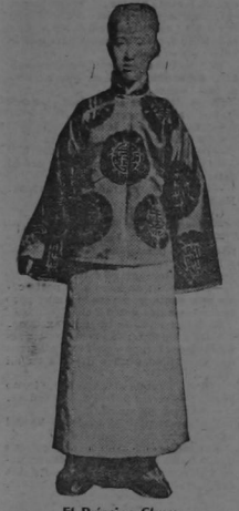
El Príncipe Chum,

á quien han hecho referencias los cables en estas últimas días, por ser la persona de la familia real china, que más se opone á la abdicación del Emperador.