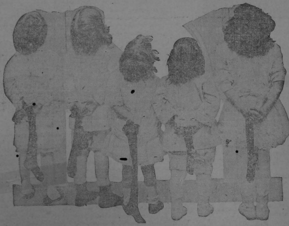
Qué lindos discos.—Si papá tuviera uno así en su Establecimiento, todo el mundo iría a comprar allá.

Con lo que consume una lamparilla corriente de luz eléctrica, se alimenta la deslumbradora luminosidad de estos discos que pueden verse a un kilómetro de distancia.