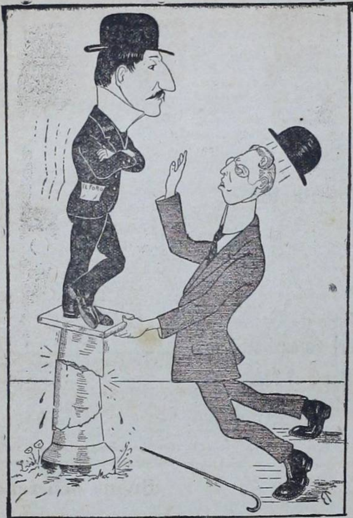
DON RAMÓN:—¡Téngase! DON LUIS:—Con usted voy a cualquier parte.