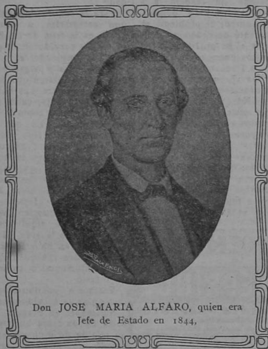
Don JOSE MARIA ALFARO, quien era Jefe de Estado en 1844.

El 14 regresé a San José y el 20 a Puntarenas, donde tuve que aguardar un mes antes de encontrar un barco que me llevase al Norte. En este lugar me atacó una enfermedad peculiar del país, o sea diviesos, que empiezan con una gran hinchazón colorada y producen un dolor tan grande que los que no lo han sentido difícilmente pueden imaginarlo. Cada divieso dura unos ocho días, durante los cuales el paciente tiene fiebre constante y no puede dormir ni hacer nada. Varias personas habían muerto en Puntarenas de disenteria y pude curar a unas cuantas que estaban padeciendo gravemente de este mal, entre otras al Administrador de la Aduana. Mi principal receta consistía en una onza de creta preparada y bien mezclada con media docena de claras de huevos.