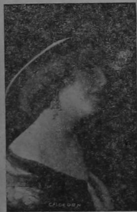
DOÑA ZULEMA DE BARILARI

Es muy grato para La Opinión saludar en el día de hoy, con motivo de la