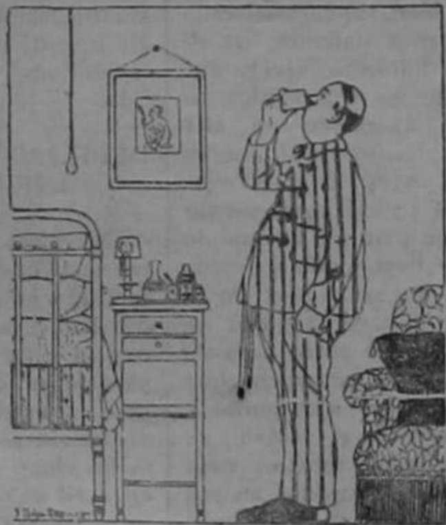
A las 10 de la noche : una copa de URODONAL

No hay que esperar tener cálculos, gota, mal de piedra ó reumatismo para tomar el URODONAL