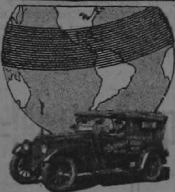
Servicio Seguro Este Big-Six recorrió 764.300 kilómetros en caminos montañosos, llevando pesadas cargas de periódicos, en buen e mal tiempo.

La Casa más Grande del Mundo en la Construcción de Automóviles de Calidad