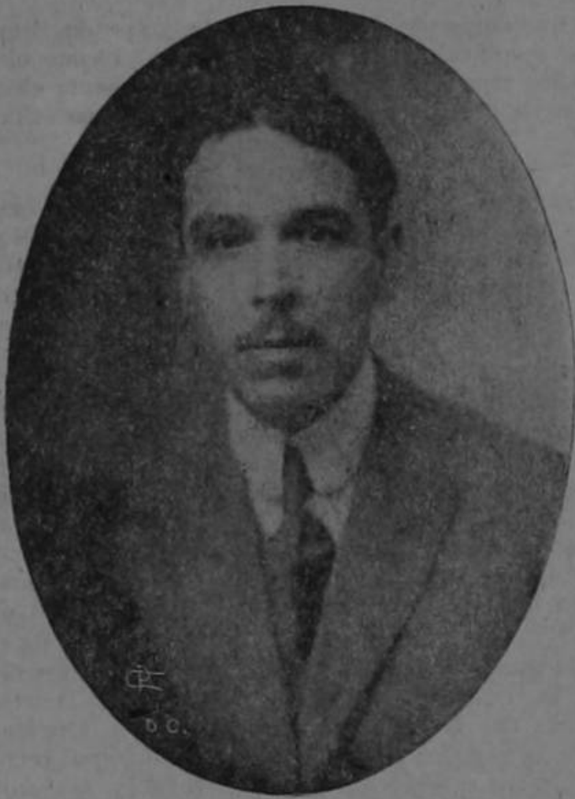
Lic. don Alfredo González Flores

Ex-Designado a la Presidencia, quien ejerció el Poder Ejecutivo de 1914 a 1917