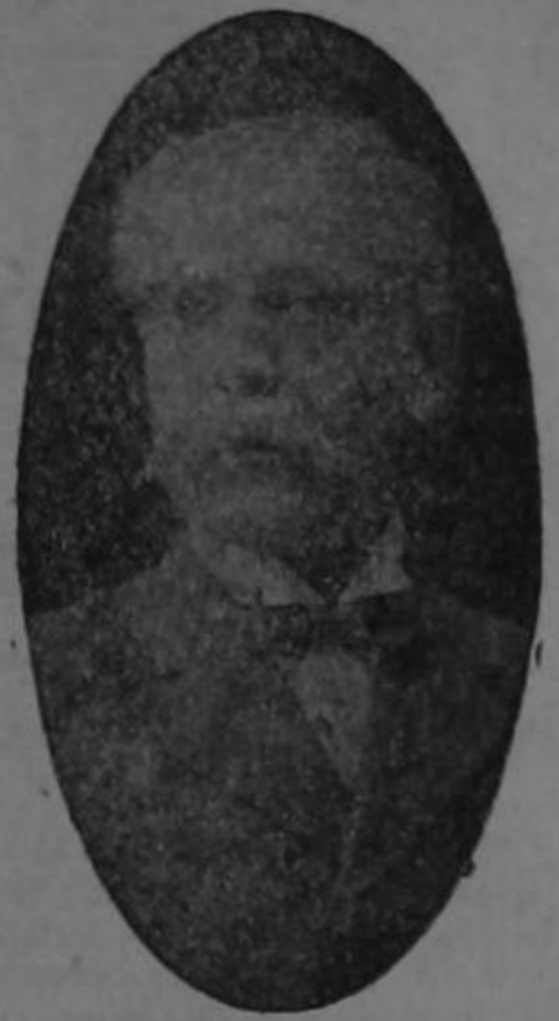
Lic. don Bernardo Soto

Ilustre hijo de Alajuela, ex-Presidente de la República, Benemérito de la patria.