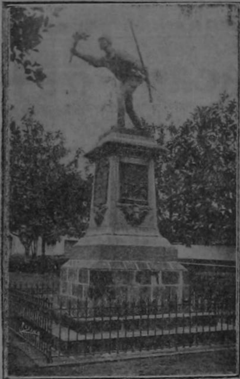
Monumento a Juan Santamaría

héroe nacional de la Campaña de 1856, hijo predilecto de la ciudad de Alajuela y de la patria costarricense.