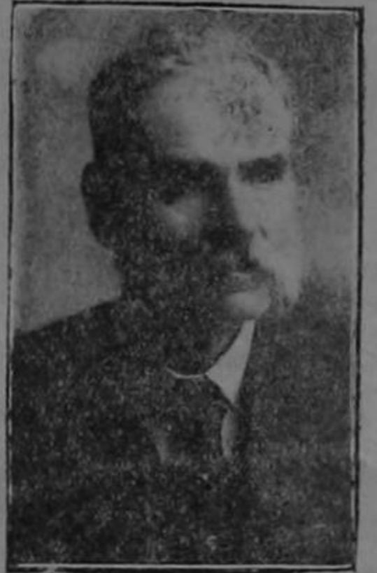
Don Domingo González Pérez

Ilustre hijo de Alajuela, ex-Presidente de la República, Benemérito de la patria.