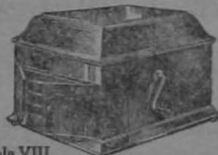
Victrola VIII Roble