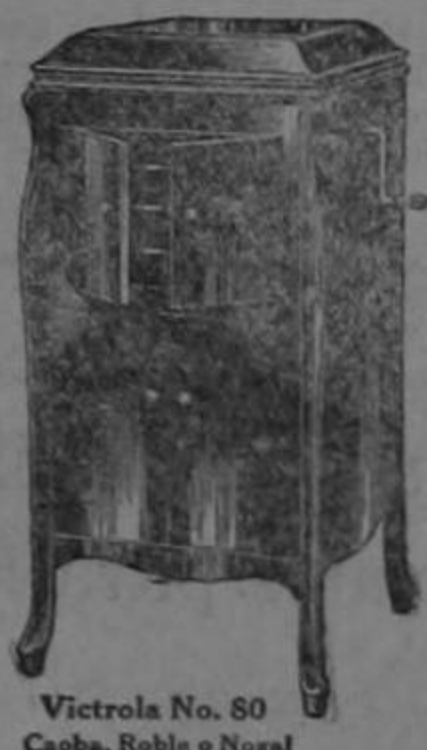
Victrola No. 80 Caoba, Roble o Nogal

REG. U.S. PAT. OFF. M. & F. MARCA INDUSTRIAL REGISTRADA Estas marcas de fábrica de la Victor aparecen en la tapa de los instrumentos y en la etiqueta de los discos Victor Talking Machine Company, Camden, N.J.E.U.de A.