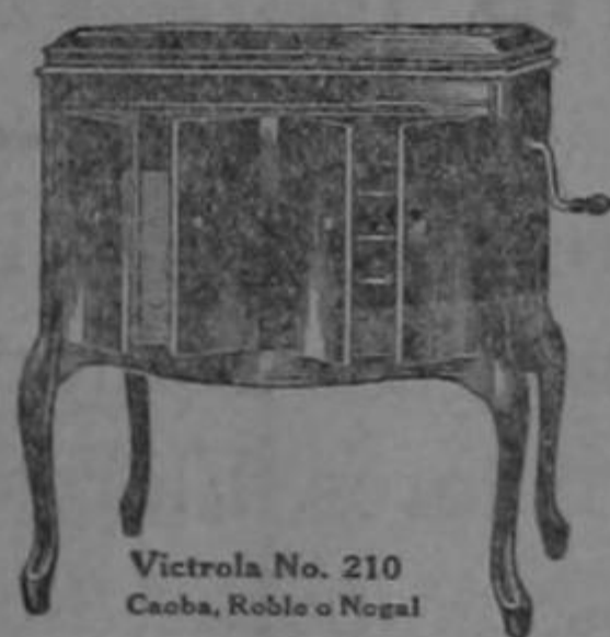
Victrola No. 210 Caoba, Roble o Nogal