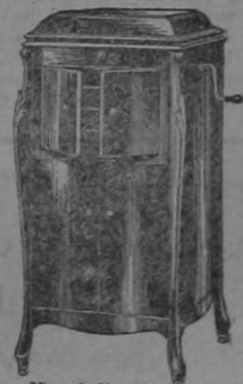
Victrola No. 100 Caoba, Roble o Nogal