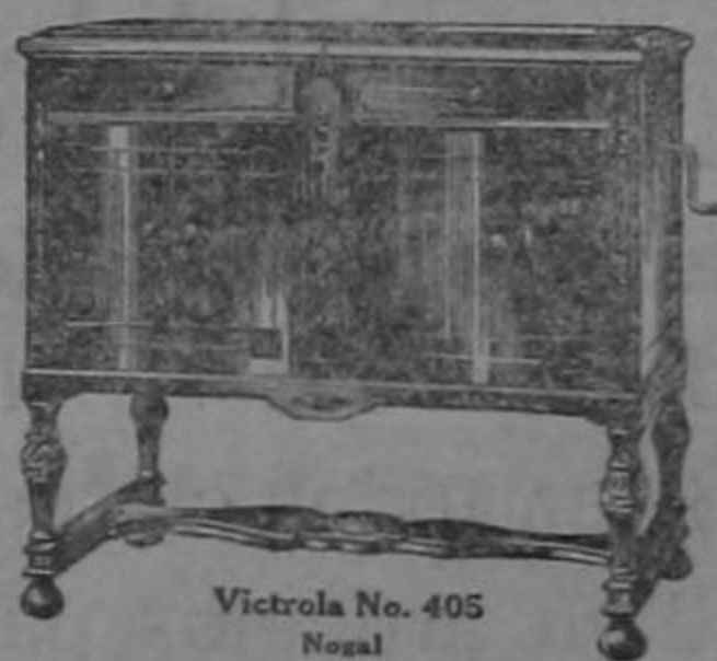
Victrola No. 405 Nogal